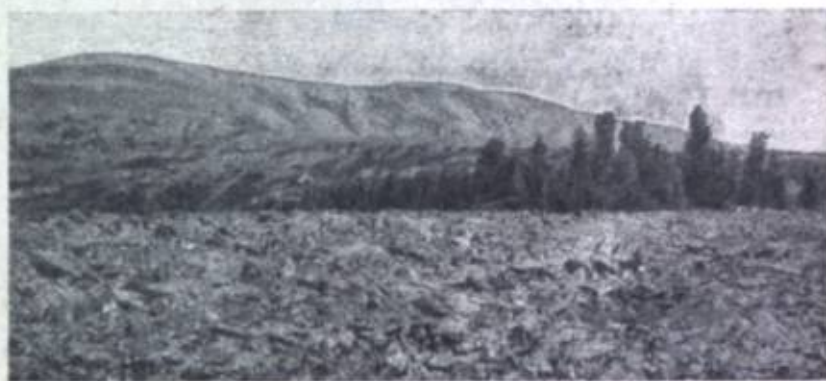
Фиг. 4. Главная вершина гольца Кентей-хан. Слева видим три нагорных террасы.

Соболь почти совершенно истреблен по Керулени, и сохранился в северной Монголии в более или менее значительном количестве лишь в верховьях Мензи, Тола (рр. Хагги и Хонгор) и Иро (р. Юсутэ).