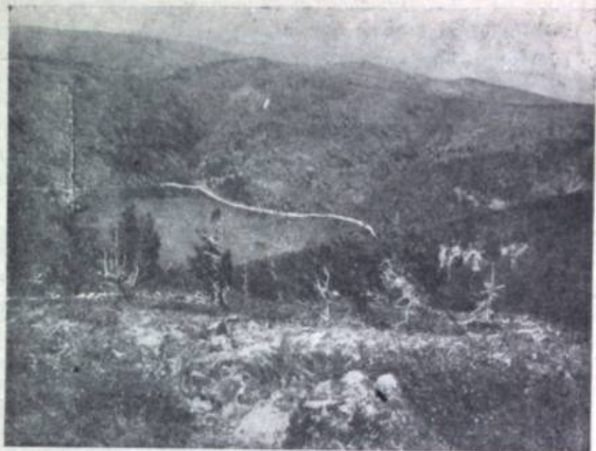
Фиг. 2. Кентейское озеро, расположенное в ледниковом цирке, у южного подножья Кентей-хана.

Как видно из этого беглого очерка орографии и растительного покрова верховьев Керулена, мы имеем здесь над зоной горной тайги достаточно широко развитую гольцовую зону, а в ближайшем соседстве находятся еще онеонские гольцы, таким образом мы в праве были бы ожидать здесь полный комплекс альпийской фауны. Между тем из млекопитающих нами встречены только скалистая пищуха, суслик, горностаи, лисица и заяц. На самой вершине Кентей-хана, маленькое болотце высокогорной тундры было сплошь изрыто кабанями. Все перечисленные животные отнюдь не характерны для альпийской зоны, и с таким же, если не с большим, успехом живут на горных лугах, в тальвегах рек, и в россыпях среди лесов. Типичных обитателей высокогорья, какими являются, например, горные бараны, — здесь нет. Из птиц на Кентей-хане найдено только два вида, свойственные высокогорным областям: белая куропатка Lagopus lagopus и завирушка Laiscopus collaris . Рядом с этими птицами альпийской зоны, на вершине гольца во множестве гнездятся: обитатель горных степей рогатый жаворонок Otocoris brandti и субальпийской зоны конек Anthus spinoletta , а также встречается вид, не привязанный к определенной вертикальной зоне, — чекан Oenanthe oenanthe . Если прибавить сюда еще гор-