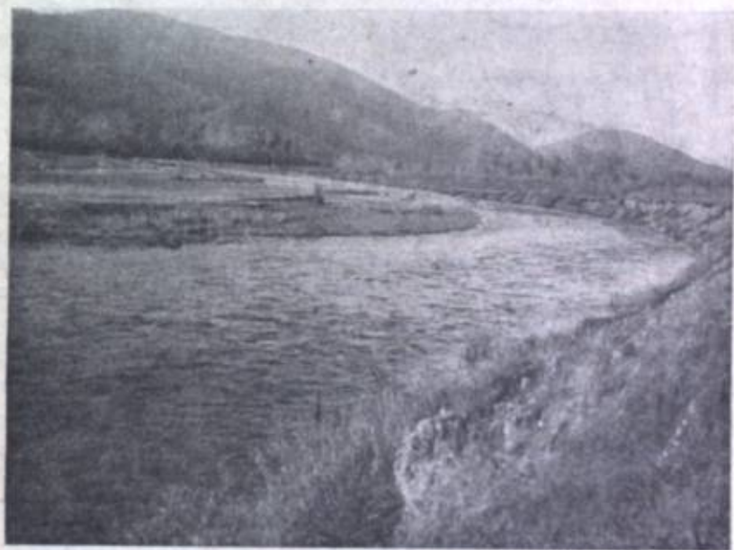
Фиг. 3. Р. Керулен, в районе впадения р. Илюр. На заднем плане густая древесная урема.