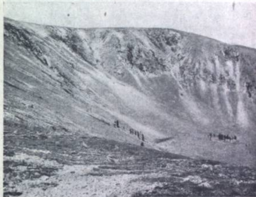
Фиг. 1. Ледниковый кар у подножия гольца Кентей-хан (В склон гольца).

К В от Кентей-хана вздымаются четыре куполообразных гольцовых вершины, южные склоны которых дают начало ключам, питающим р. Керулен, а северные принадлежат уже бассейну Онона. Пятый