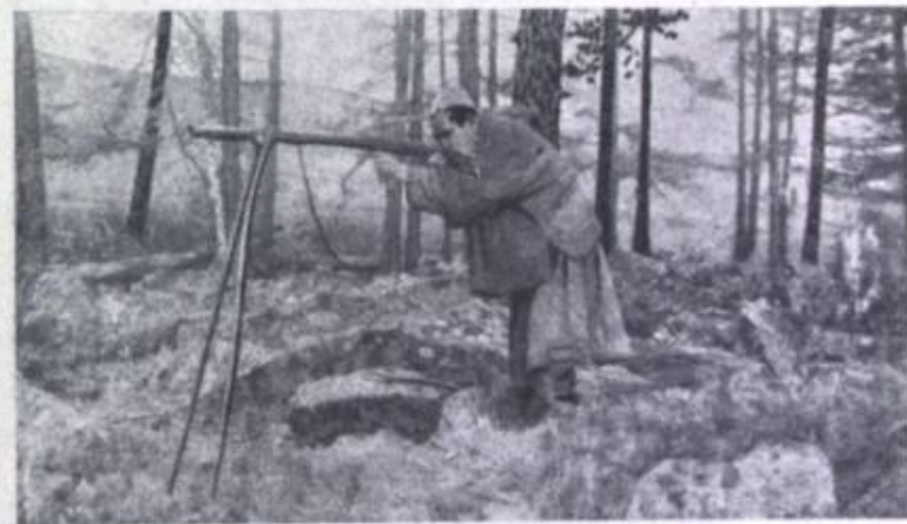
Фиг. 7. Старый охотник монгол Гомбжив.

и создания целесообразно расположенных и организованных заповедников. В настоящее время на территории Монголии еще сохранились местные заповедники, расположенные совершенно случайно и нецелесообразно, в районах каких-либо горных вершин, по преданию считающихся священными.