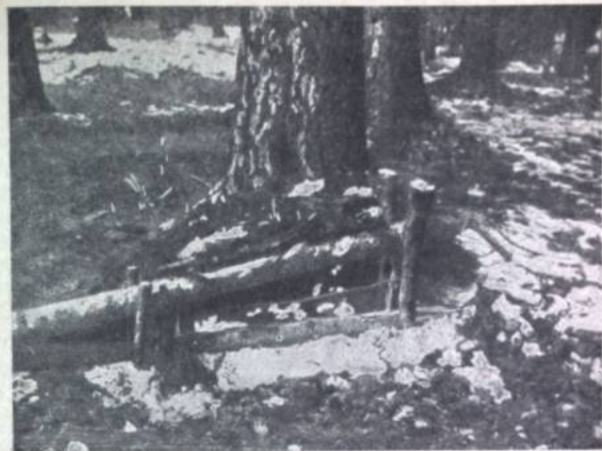
Фиг. 6. Деревянная ловушка „кулемка“, на колонки.

Причины уменьшения количества промысловых животных лежат главным образом в неправильной, беспорядочной и хищнической охоте, которую до последних лет вели главным образом русские охотники, приходившие на Керулен с Мензи. Буряты, в отношении употребления разных запрещенных ловушек, также не отставали и промышляют с их помощью и сейчас. На этот факт следовало бы обратить внимание и в ближайшее время начать работу в двух направлениях: пропаганды и внедрения законов о правильной охоте, и в направлении планировки