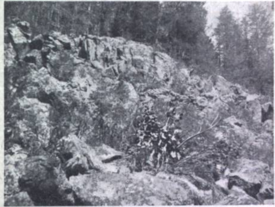
Фиг. 5. Каменная россыпь в лесу. Стация кабарги.

нисколько не мешали частые выстрелы, рубка леса и лай собак. Между тем другие животные — кабаны и изюбри — давно покинули наше соседство. При виде человека, кабарга пугается, издает свое мягкое „фшшш“ и делает два-три огромных прыжка. Затем она останавливается и смотрит на человека. Если ее не стрелять, и если, конечно, ветер не наносит на нее запах человека, то она будет довольно долго стоять таким образом, шагах в ста от охотника, и ее свободно можно до тонкости рассмотреть в бинокль.