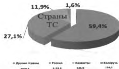
Рисунок 2. Структура товарооборота Кыргызской Республики со странами Таможенного союза за 2013 год. 1

Следует отметить, что страны Таможенного союза являются региональными торговыми партнерами Кыргызской Республики. По итогам 2013 года Кыргызская Республика осуществляла торговые отношения с более чем 140 странами мирового торгового сообщества.