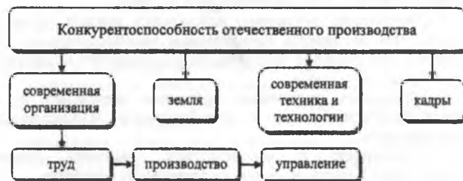
Рис. 1.1 – Факторы, влияющие на повышение конкурентоспособности продукции.