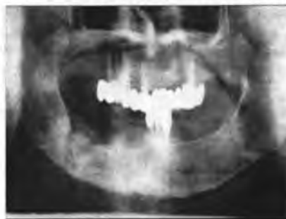
Рис. 6. Больной А., 63 г. Р-грамма больного. Ds.: хронический остеомиелит нижней челюсти (секвестр).

При проведении рентгенологического исследования в основной группе через 3-4 недели выявлено, что у пациентов с применением светоизлучения определялась размытость контуров лунки удаленного зуба, завуалированность интенсивной тенью костной мозоли, в области ее дна прослеживались единичные костные трабекулы, т.е. отмечалось восстановление костного дефекта на 25,3 \pm 1,8 суток ( P < 0,05 ) (рис. 6, 7).