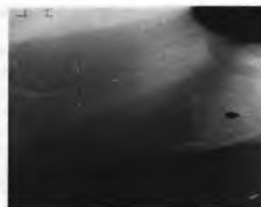
Рис. 4. Основная группа - дефект костной ткани через 20 дней.

Через 60 дней большинство дефектов опытной стороны полностью замещены костной тканью, структура новообразованной костной ткани не отличается от окружающей.