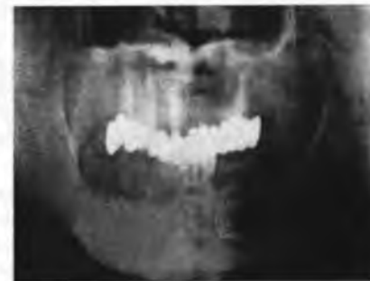
Рис. 7. Больной А., 63 г. Р-грамма больного после лечения.