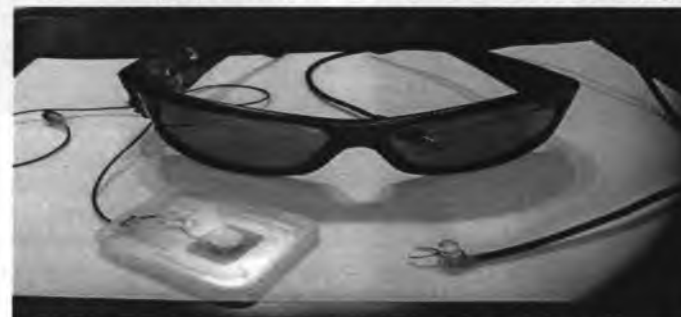
Рис. 1. Общий вид фотодинамического устройства.

Фотодинамическая терапия больных основной группы осуществлялась с применением нашего устройства (Патент КР №134 от 30.12.2011 г.) (рис. 1)