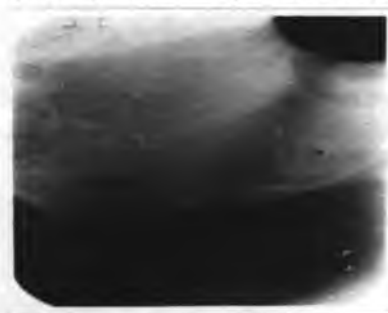
Рис. 3. Группа сравнения - дефект тела нижней челюсти через 60 дней.

Через 60 дней большинство дефектов опытной стороны полностью замещены костной тканью, структура новообразованной костной ткани не отличается от окружающей.