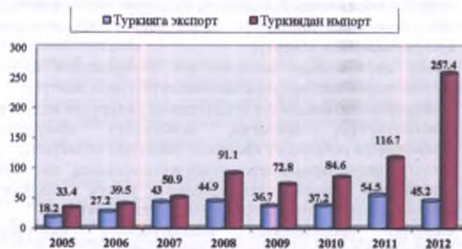
2-сүрөт. Кыргызстан менен Түркиянын соода балансы (млн. АКШ долл.) 11

2-сүрөттө көрсөтүлгөн маалыматтын анализи, Кыргызстан менен Түркиянын ортосундагы соода-экономикалык мамилелер акырындап өнүгүп жатканына маалымдайт, бирок айрым бир жылдары объективдүү бир себептерден улам көрсөткүчтөр төмөндөгөн. Дээрлик деңгээлде Түркиядан импорт көбүрөөк келип, ал эми кыргыз ишканаларынан Түркияга товар экспорттоо азырынча жокко эсе.