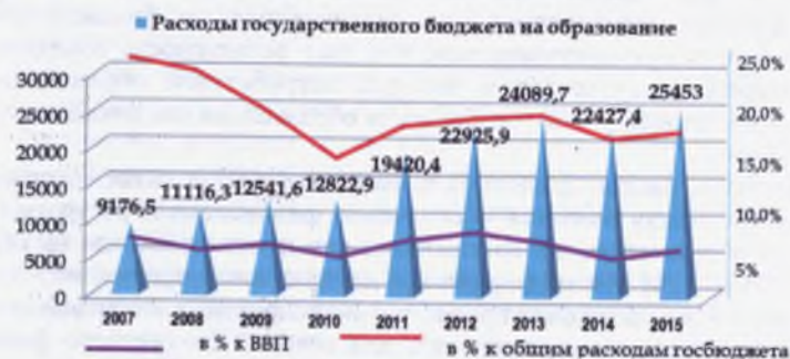
Рис.2.1. Расходы государственного бюджета на образование в Кыргызской Республике за 2007-2015 гг., млн сомов

Диагностика государственного бюджета Кыргызской Республики показала, что расходы на сектор образования - основная часть финансирования социального сектора экономики (36,2% от общих социальных расходов 2015г.). Однако, доля финансирования сектора образования в общих расходах государственного бюджета имеет динамику снижения (рис.2.1.).