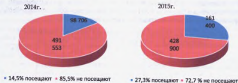
Рис. 2.2. Охват детей дошкольным образованием в Кыргызской Республике в 2014-2015 гг., %

В 2015г. в республике функционировали 1186 дошкольных образовательных организаций (ДОО), или по сравнению с 2007г. их количество увеличилось в 2,5 раза. Общий охват детей дошкольного возраста составлял 161,4 тыс. детей, тогда как на 01.01.2015 г. численность детей от 2 до 6 лет составляла 590,3 тысяч, или общий охват детей дошкольным образованием, включая общинные детские сады, составлял всего 27 % от общего числа детей дошкольного возраста.