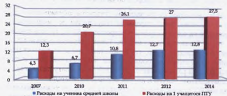
Рис. 2.4. Расходы государственного бюджета на одного учащегося в Кыргызской Республике за 2007-2014 гг., тыс.сомов

Диагностика нормативных расходов по программам показала, что наиболее затратным для государства является среднее профессиональное образование (СПО). Так, в среднем госрасходы на одного учащегося СПО в 2 раза выше, чем расходы на школьника (рис.2.4), связанные, главным образом, с высокими расходами на содержание инфраструктуры (производственные и учебные корпуса, общежития), которая рассчитана на большее количество студентов. Следует отметить, что численность учащихся СПО возросла с 69,5 тыс. в 2007г. до 90,6 тыс. в 2014г., но это практически не изменило ситуацию. Оценка использования бюджетных средств констатирует их неэффективность, к тому же отмечается тенденция ее увеличения: порядка 10% бюджета образовательных организаций направляется на учебный процесс, в то время как 90% направляется на содержание педагогов, административно-хозяйственного персонала и инфраструктуры.