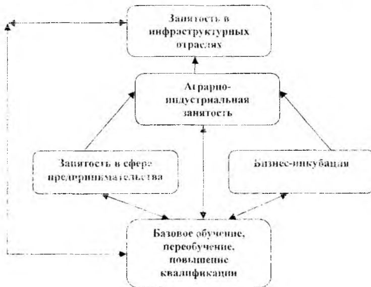
Рис. 2. Путь преодоления бедности сельских жителей в условиях непрерывного образования

Предложенные пути усиления воздействия занятости на сокращение бедности сельского населения необходимо объединить в комплекс посредством профессиональной подготовки и идеи непрерывного образования сельского населения как наиболее прогрессивной основы поддержки качества рабочей силы и ее эффективной занятости (рис.2).