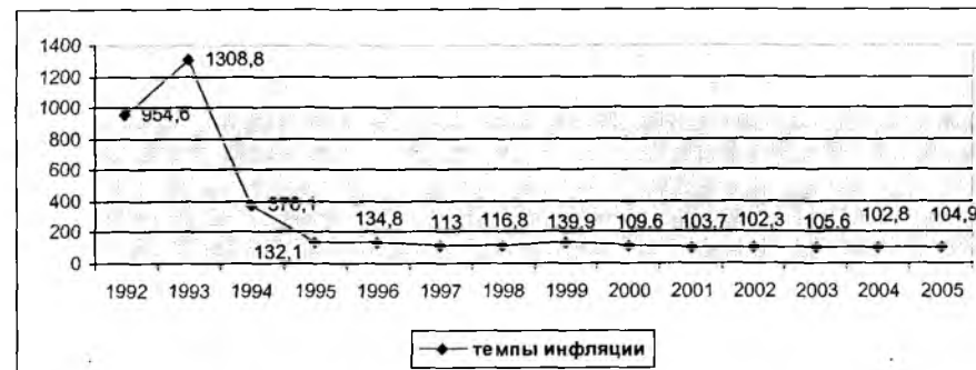
Рис. 2. Темпы роста индекса потребительских цен 1 (в % к декабрю предыдущего года)

Одним из существенных факторов, характеризующих стабилизационные процессы, является резкое снижение темпов инфляции. Если в 1991 – 1993 гг. наблюдалась гиперинфляция, то с 1997 г. начинается сдерживание темпов инфляции. На рис. 2. дается динамика индекса потребительских цен за 1992 – 2005 гг., которая показывает общую картину темпов инфляции за годы независимости республики.