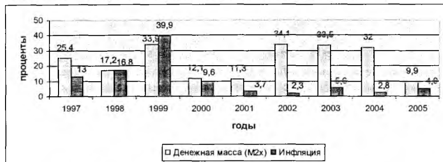
Рис.3. Темпы прироста денежной массы и инфляции (в процентах за период) 1

Значительное влияние немонетарных факторов на инфляционные процессы в Кыргызстане подтверждаются данными о динамике темпов прироста денежной массы и инфляции за последние годы. Увеличение денежной массы уже длительное время не приводит к адекватному росту цен.