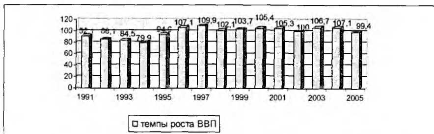
Рис. 1. Темпы роста валового внутреннего продукта КР 1 (в % к предыдущему году)

В развитии экономики Кыргызстана можно проследить следующие макроэкономические тенденции. Как видно из диаграммы (рис. 1.), особенно критическими были 1991-1995 гг., когда ежегодно падал ВВП. Этот период стал не столько периодом экономических реформ, сколько периодом не очень успешной борьбы с экономическим кризисом. 1996 г. наступила фаза стабилизации. Произошел перелом, когда начали работать рыночные механизмы, что подтверждается макроэкономическими показателями 1997 г. Наибольший темп роста ВВП приходится на 1997 г., когда он составил 109,9 %. После этого резкие спады темпов роста ВВП приходятся на 1998 г., 2002 г., 2005 г., причинами которых были, прежде всего, политические ошибки руководства. По диаграмме можно отчетливо проследить темпы роста реального ВВП.