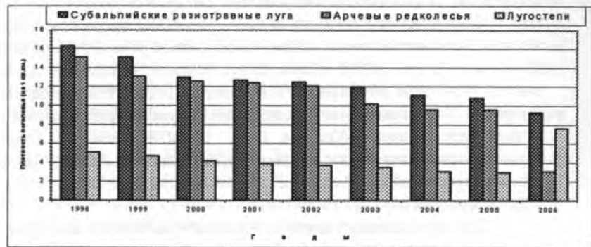
Рис.1. Динамика численности красного сурка ( Marmota caudate ) в Гульчинском участке очаговости чумы

Во всех ландшафтах Гульчинского участка очаговости чумы численность красного сурка очень низка, по сравнению с положением в Восточно-Алайском и Западно-Алайском участках очаговости. Особенно это связано в последние годы с усилением браконьерства и уничтожением их места обитания,