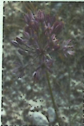
Рисунок 5.5 A. gracillimum

5.2. Новые для Кыргызстана и отдельных районов виды. Впервые отмечены восемь новых для территории Кыргызстана видов: A. ericoleum , A. gracillimum (рисунок 5.5), A. kirilovii , A. marmoratum , A. michaelis (рисунок 5.6), A. pangasicum (рисунок 5.7), A. strictum , A. vvedenskyanum , а также даны новые и уточняющие сведения по распространению 14 уже известных на территории Кыргызстана видов рода Allium ( A. aflatumense , A. arkitense , A. filidens , A. galanthum , A. karelinii , A. longicuspis , A. minutum , A. obliquum , A. oreophiloides , A. oreoscordum , A. oschaninii , A. parvulum , A. petraeum , A. pseudowinklerianum ).