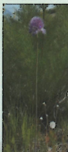
Рисунок 5.7 A. pangasicum .

5.3. Вид, восстановленный из синонимов. Один вид, A. caricifolium Kar. et Kir., восстановлен из синонимов.