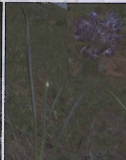
Рисунок 5.2 A. susamyricum .