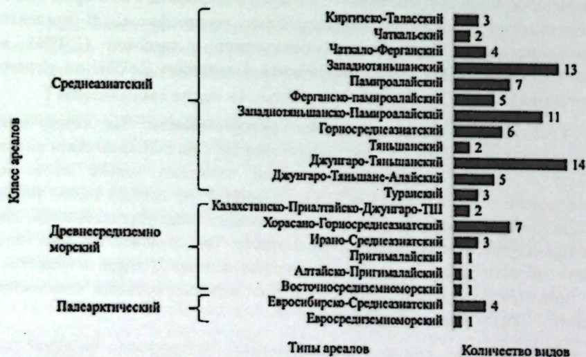
Рисунок 4.3 Ареалогическое распространение видов.

4.6.2. Общий ареалогический анализ. Виды рода Allium отнесены к 20 типам ареалов, объединённых в 3 крупные класса (рисунок 4.3).