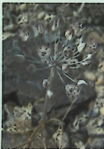
Рисунок 5.6 A. michaelis .