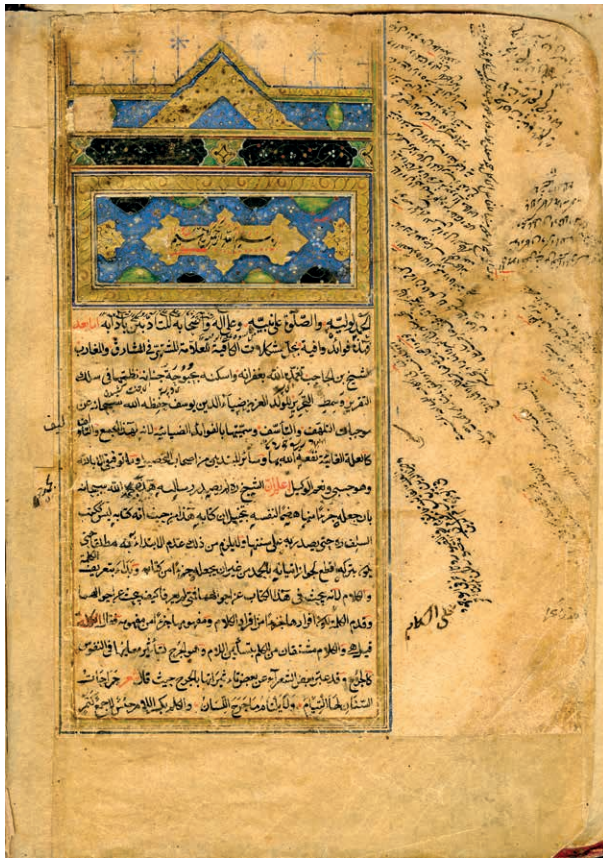
Титульный лист рукописной книги