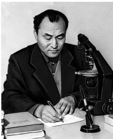
Академик М.М. Адышев