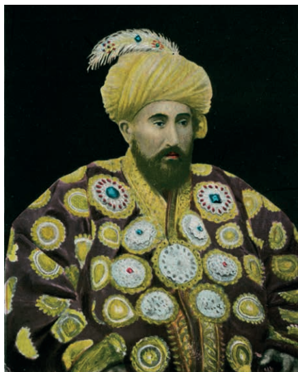
Сейид Музаффар-Эддин-Багадур-хан, эмир Бухарский