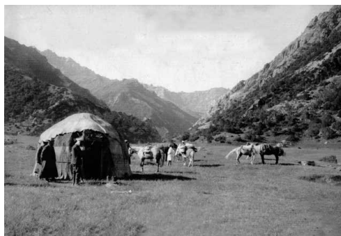
В кочевье Курманджан датки