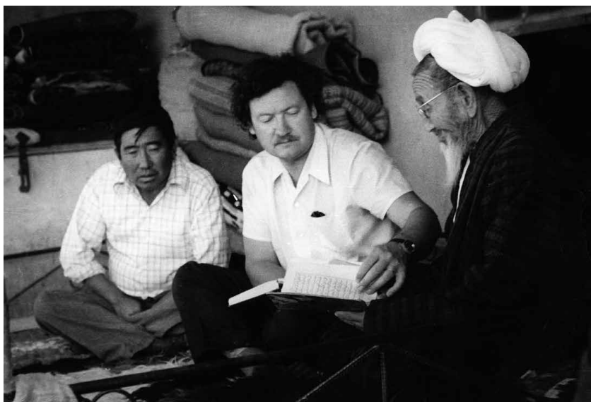
За сбором старинных рукописей и книг на юге Кыргызстана (палеографическая экспедиция 1976 г.)