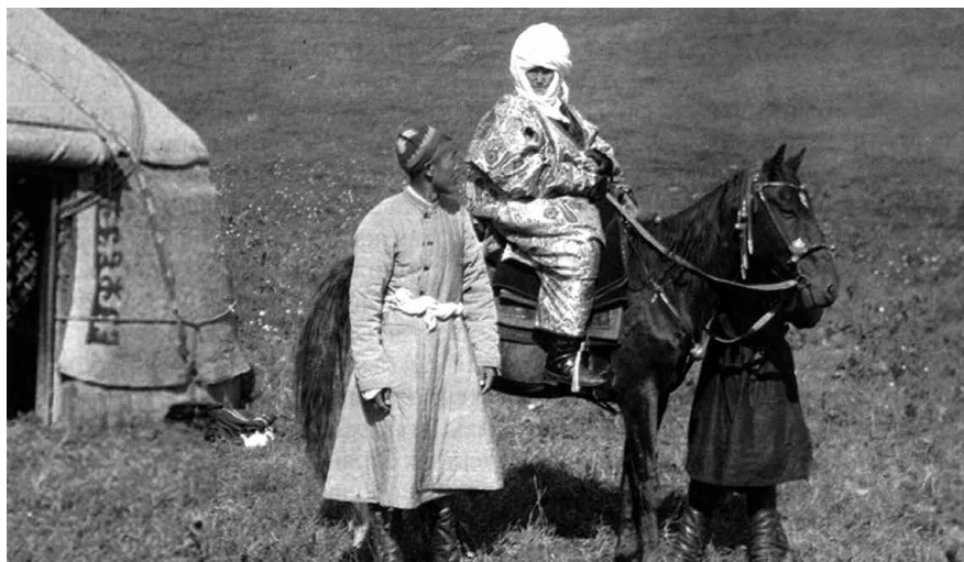
Курманджан датка в 96-летнем возрасте (фото К.Г. Маннергейма)