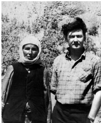
Встреча с одной из внучек Курманджан (Алай, археологическая экспедиция 1962 г.)