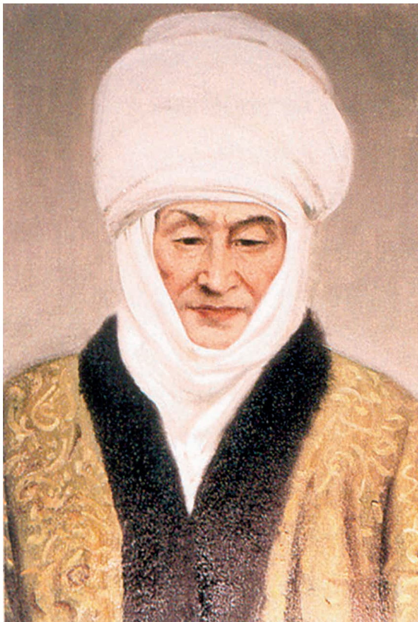
Курманджан датка – Алайская царица (из архива кокандских ханов)