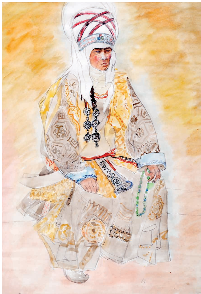
Курманджан датка глами художника (картина С. Чокморова)