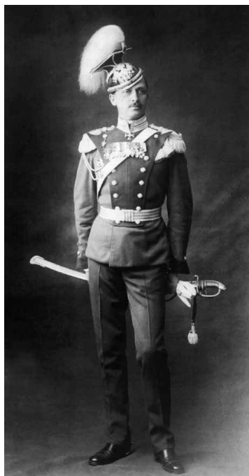
Полковник Генерального штаба К.Г. Маннергейм в парадной форме (1909 г.)