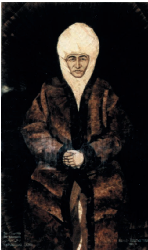
Курманжан датка (в изобразительном искусстве, на марках, на денежной купюре)