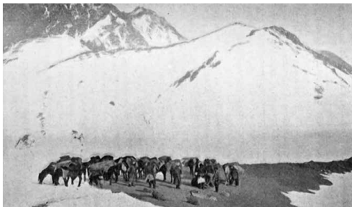
На зимних стойбищах Алая