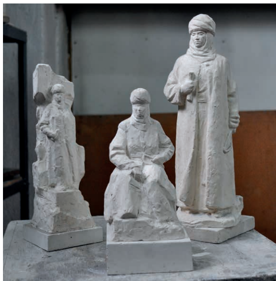
Варианты памятника Курманджан датке