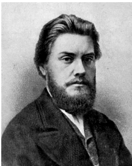
Русский путешественник А.П. Федченко