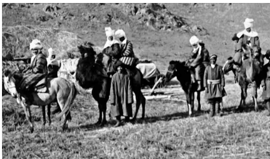
Перекочевка алайских кыргызов