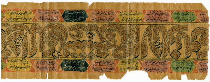
Фрагмент родословной рукописи кыргызов (из архива палеографической экспедиции)