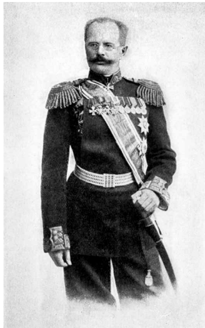
Генерал-майор М.Е. Ионов