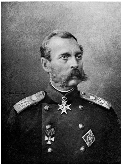
Император Александр II