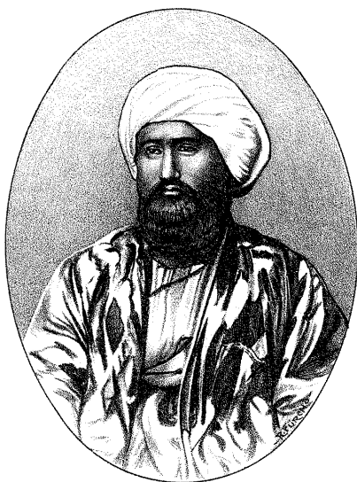
Кокандский хан Худояр