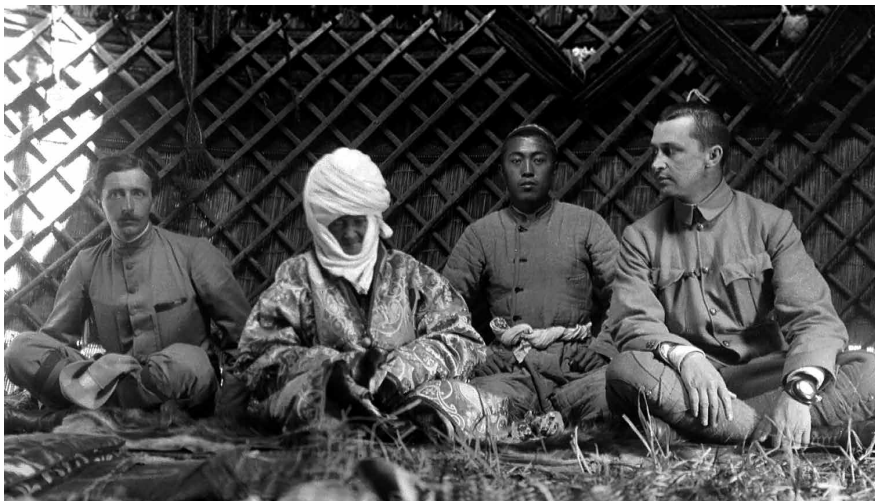
В гостях у Курманджан датки (слева направо: П. Пеллиот, Курманджан, ее внук, К.Г. Маннергейм)