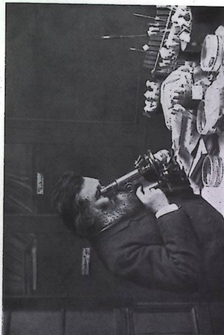
И. И. Мечников. Фотография 1914 г..