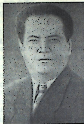
А И Б Е К

Имамов Б. Сатира и юмор в творчестве Гафура Гуляма. — «Звезда Востока», 1957, № 6, стр. 146—153.