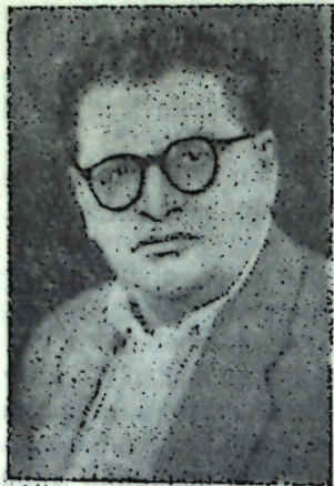
Ш Е Й Х З А Д Е