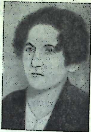
А И Д Ы Н