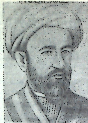
Ф У Р К А Т

Швердин М. Сатира Мукими. — «Звезда Востока», 1953, № 9, стр. 117—125.