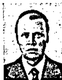
БОЛОТИН ВЛАДИМИР ВАСИЛЬЕВИЧ

Родился 8(21) июля 1915 г. Литературовед. Член-корреспондент по Отделению литературы и языка (литературоведение) с 26 ноября 1974 г.