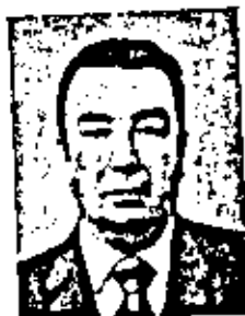
ПРИМАКОВ ЕВГЕНИЙ МАКСИМОВИЧ

Родился 7 января 1918 г. Ученый. Член-корреспондент по Отделению физико-химии и технологии неорганических материалов (неорганическая химия) с 26 ноября 1974 г.