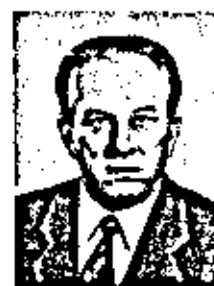
БОЛЬШЕВ ЛОГУН НИКОЛАЕВИЧ

Родился 29 марта 1928 г. Специалист в области механики. Член-корреспондент по Отделению механики и процессов управления (механика) с 26 ноября 1974 г.