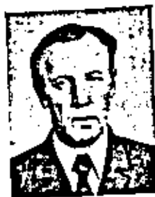
ПОНОМАРЕВ ЛЕВ СЕРГЕЕВИЧ

Родился 20 октября 1928 г. Специалист в области энергетики. Член-корреспондент по Отделению физико-технических проблем энергетики (энергетика) с 26 ноября 1974 г.