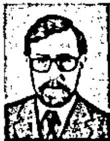
СПИРИДОН АЛЕКСАНДР ГЕОРГИЕВИЧ

Родился 21 февраля 1935 г. Биохимик. Член-корреспондент по Отделению биохимии, биофизики и химии физиологически активных соединений (биохимия) с 26 ноября 1974 г.