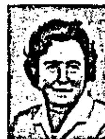
БУТЕНКО РАНСА ГЕОРГИЕВНА

Родился 6 марта 1922 г. Математик. Член-корреспондент по Отделению математики (математика) с 26 ноября 1974 г.