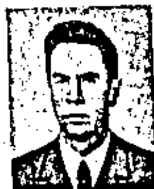
РЕШЕТНИКОВ ФЕДОР ГРИГОРЬЕВИЧ

Родился 29 октября 1929 г. Экономист. Член-корреспондент по Отделению экономики (экономика) с 26 ноября 1974 г.