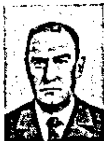
БЕРДНИКОВ ГЕОРГИЙ ПЕТРОВИЧ

Родился 8(21) июля 1915 г. Литературовед. Член-корреспондент по Отделению литературы и языка (литературоведение) с 26 ноября 1974 г.