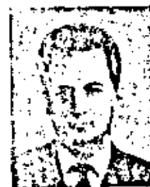
ДЗЯЛОШНИНСКИЙ ИГОРЬ ЕХИМЕЛЬЕВИЧ

ГОИЧАР АНДРЕЙ АЛЕКСАНДРОВИЧ Родился 21 ноября 1931 г. Математик. Член-корреспондент по Отделению математики (математика) с 26 ноября 1974 г.