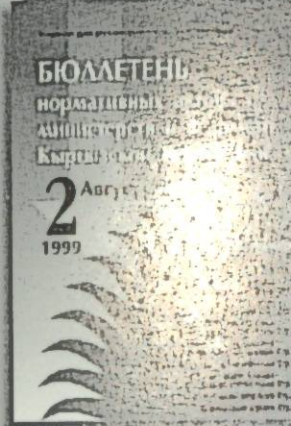
Подписной индекс 77396

Как подписаться на Бюллетень?.. Очень просто!