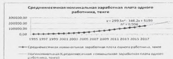
Рисунок 2.6. Трендовая модель тенденции роста среднемесячной заработной платы в Казахстане

Аналогичным методом, нами построена трендовая модель роста среднемесячной номинальной заработной платы Казахстана с 1995 года по 2017 год, на рис. 2.6.