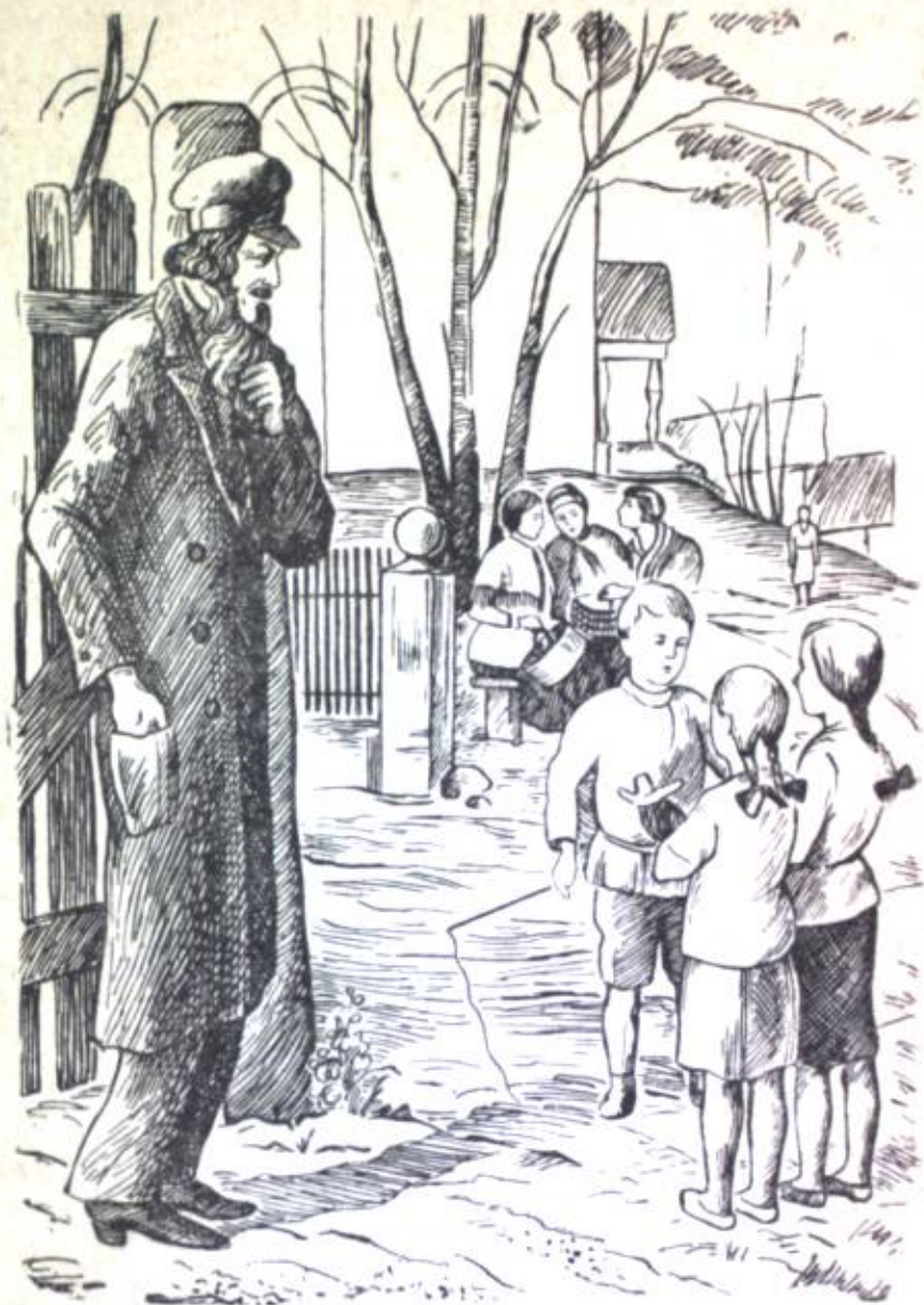
Al qajta qolun cөntөгynө salьp, cөntөгyn şьldьrattь.

Men toquz çaşta elem, Sergejka menden bir çaş kicyu volucu, viroq maça qaraçanda alda qanca tьñ ele; al arьq, cась-vaşь yrөjгөн, tikenektyu valьq syjaqtuu tikciygen, өз vilgenin verwegen, sözgө ysty ystynө qajrattanqan bala ele. Anьn көzdөry dyjnөdө ar tyrdyy sonun „nerselerdi“ көryyгө, uqmuştu tavuuqа ьqtuu volucu. Anda-sanda majьrtarqа çе volboso şajkelen kişilerge ar tyrdyy qurt-qumursqalarqа çana qonuzdarqа, cьmьcьqtьn ujalaryna eñ ele sonun cөp-tөгө çana gyldөrgө ьnaç volucu. Turmuştu tekşeryyгө anьn ьqtuuluq sezimi var volucu, al turmuş volso, anь kim çaq-şь көрсө, al daqь aqа marttьq menen valanьn çyрөгynө