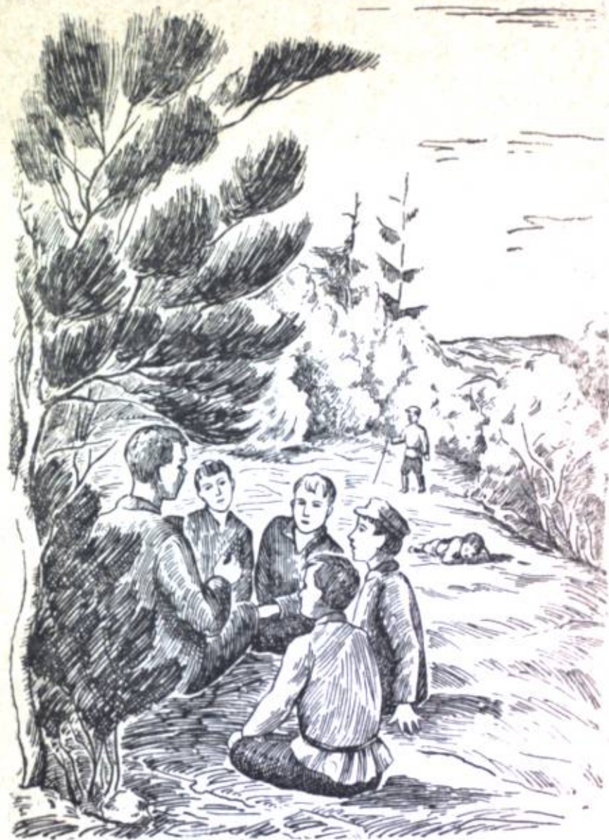
...men, vizdin көсөнүн балдарын сынар алып, аларды ертең менен талааға, тоқойға алып вардым.

Аңқыса ал бир kezде, авдан тынс çана çажварақат турүр: