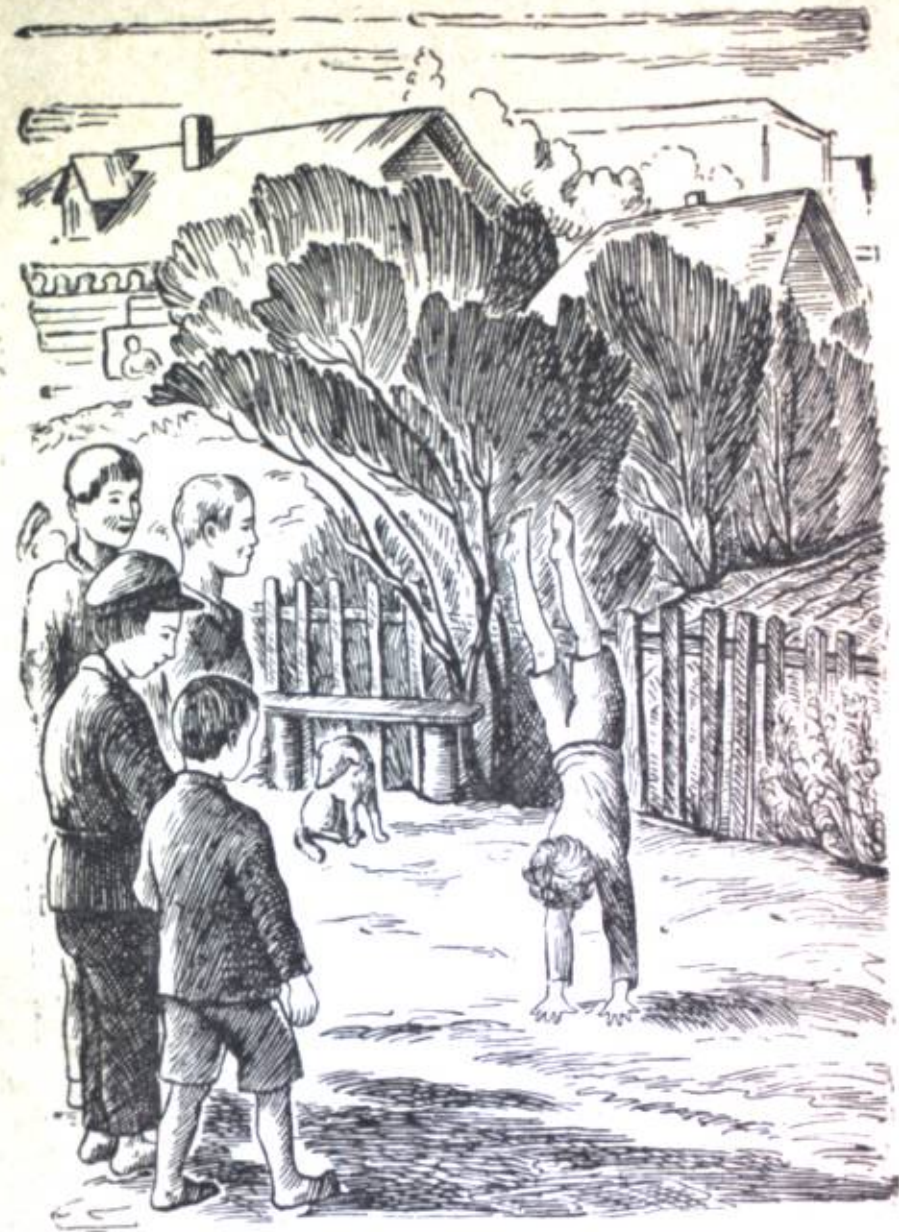
Bala qolu menen çer tajanыp, tike turdu da butun çoqoru көterdy.

Biroq, vul көnyldyy minutalar vat ele çoq volup ketti, al vala ŷamdaqajlyq көnygyylөryn çasar bytkөndөн kijin val-