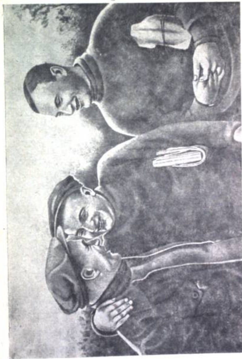
Sovetter Soıuzunun asatırılar Ckalov, Bajdukov çana Beljakov.

Biz oşoncolıq şaşqandıqtan propuska alıunu da unıup qoıoıon ekenız, biz al tuuralı Kremlin darbazasına kelgende estedik. Oşon-