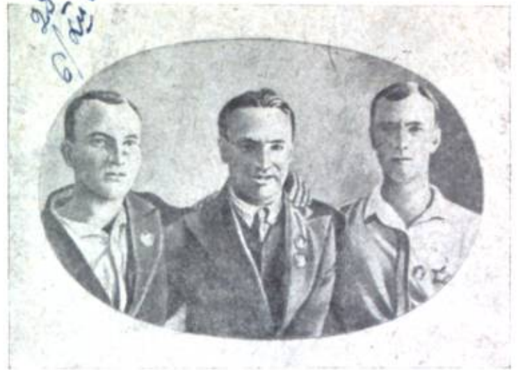
Sovetler Sojuzunun baatъrъ VALERIJ SKALOV