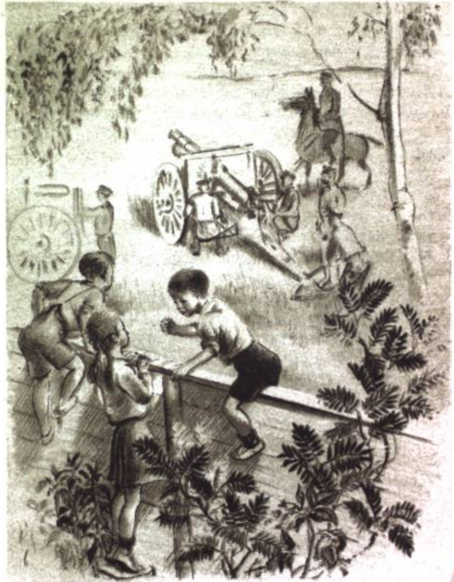
Çar-çaqьn ele çerde top-top volqon qalьd vadaldardьn arasьnda attar, eki dөngelөktyy aravalар çana zambirekter turuptur.

— Degi qьzdarđьn vaarь calqandan qorquşat emespi, — dedi.