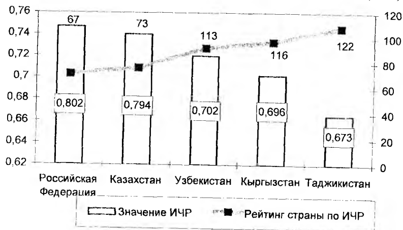
Рис. 1. Различия качества жизни в странах СНГ по ИЧР

Одним из основных показателей, характеризующих качество жизни населения является Индекс человеческого развития (ИЧР).