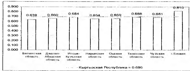
Рис. 3. Индекс развития с учетом гендерного фактора (ИРГФ) за 2006 г.

Разница между ИРЧП и ИРГФ в Кыргызстане традиционно мала, что свидетельствует о принципиальном равенстве возможностей для развития мужской и женской части населения. Расчеты индекса осуществляются с 1996г., когда он составлял 0,654, в 2004г. – 0,696, в 2006 г. его значение так же составило 0,696.