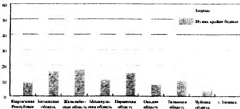
Рис. 1. Уровень бедности и крайней бедности по территории в 2006г. (в процентах)

Бедность в республике в основном распространена в сельской местности, где проживает свыше трех четвертых всего бедного населения. Неравнозначны и показатели уровня бедности и крайней бедности по территории страны. Как видно из рис.1, в 2006г. наиболее бедными были жители Жалалабатской (58,3%), Ошской (52,1%) и Баткенской (50,9%) областей. Наиболее благополучными регионами являются столица республики – г. Бишкек и прилегающая к нему Чуйская область.