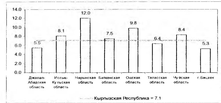
Рис. 5. Индекс нищеты населения за 2006 г.

высокий индекс наблюдался в 1998г. (10,9). В регионах самый низкий индекс сложился в 2001 г. по Таласской области (5,1) и самый высокий в 2002г. – по Баткенской области (15,9).