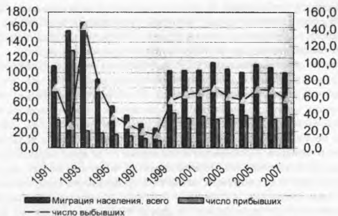
Рис. 1. Динамика изменения миграционной подвижности населения Кыргызской Республики за 1991-2007 годы, тыс.человек (по данным Нацстаткома)

территорию Кыргызской Республики является Российская Федерация и Республика Казахстан.