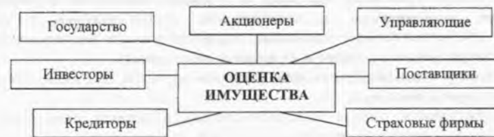
Рис. 1. Стороны, заинтересованные в оценке бизнеса

Однако не следует забывать, что каждая из сторон, заинтересованная в проведении оценочных работ, стремясь реализовать свои экономические интересы, определяют конкретные цели оценки.