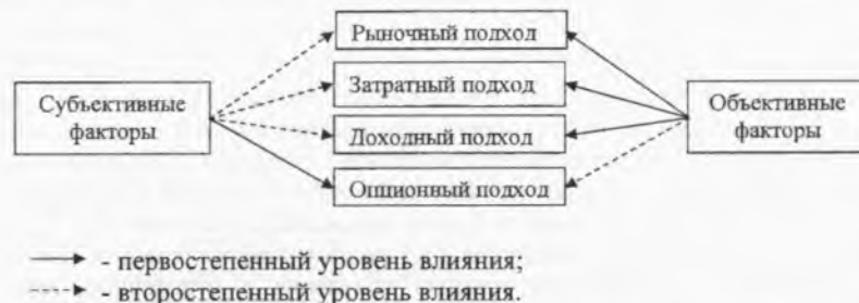
Рис. 2. Уровни влияния факторов на существующие подходы оценки

Приведенные выше выводы относительно степени влияния субъективных и объективных факторов на различные подходы оценки (степени подверженности подходов оценки влиянию со стороны факторов) можно сгруппировать в следующую схему: