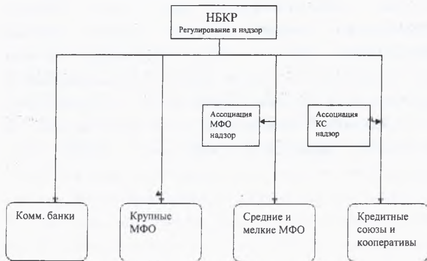
3.1 Схема регулирования и надзора.

Совершенствование нормативно – правовой базы микрофинансирования и микрокредитования следует осуществлять в части упорядочения функций Национального банка КР, делегирования ряда функций НБ КР Ассоциации микрофинансовых институтов и Альянсу Ассоциаций кредитных союзов. Рекомендовано разграничить функции НБКР и надзор и регулирование осуществлять по следующей схеме: