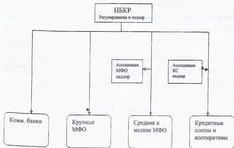
3.1 Схема регулирования и надзора.

Совершенствование нормативно – правовой базы микрофинансирования и микрокредитования следует осуществлять в части упорядочения функций Национального банка КР, делегирования ряда функций НБ КР Ассоциации микрофинансовых институтов и Альянсу Ассоциаций кредитных союзов. Рекомендовано разграничить функции НБКР и надзор и регулирование осуществлять по следующей схеме: