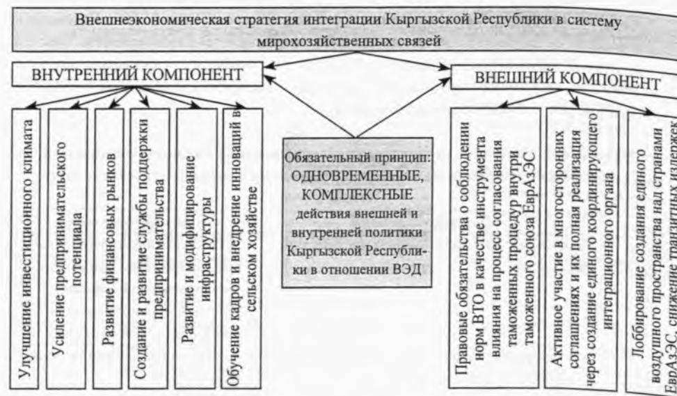
Рисунок 3. Внешнеэкономическая стратегия интеграции Кыргызской Республики в систему мирохозяйственных связей

Следовательно, основная задача внешнеэкономической стратегии Кыргызской Республики должна заключаться в параллельном сосредоточении внимания на региональном и внутреннем аспектах, на фоне системы норм ВТО.