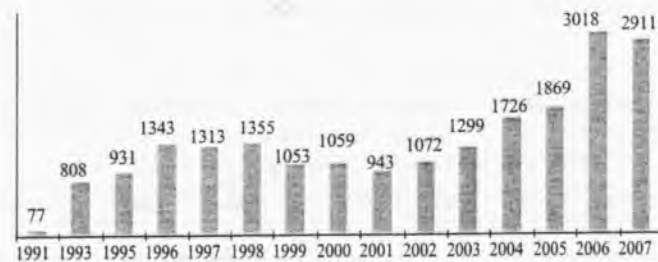
Рисунок 1. Динамика внешнеторгового оборота Кыргызской Республики, млн. долл. США

Тем не менее, на протяжении 16 лет внешнеэкономическая деятельность Кыргызской Республики расширялась как качественно, так и количественно. На рисунке 1. представлена динамика изменения объема внешней торговли Кыргызской Республики за последние 16 лет - с 1991 по 2007 год.