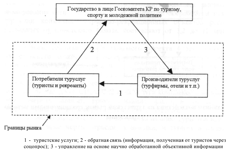
Рис.3. Механизм воздействия на туристский рынок новым информационным методом управления, основанным на концепции «обратной связи»

При этом, если хотя бы 20-30 % от общего количества туристов заполняют и оставляют анкеты, т.е. информацию об оказанных услугах, о проблемах во время путешествий и т.п., то уже этого будет достаточно для того, чтобы увидеть реальные пробелы производителей туристских услуг. Мы уверены в том, что соберется объём необходимой информации, на основе которой можно получить объективную картину рынка, тем более если учесть, что «обиженные» на производителей услуг туристы будут стараться заполнить и оставить анкеты. На основе полученной таким образом информации, причем научно обоснованной, можно будет воздействовать на производителей туристских услуг и реально управлять туристской отраслью в целях её устойчивого развития.