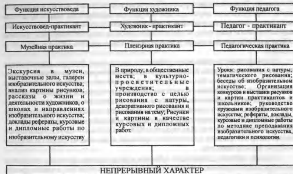
Рис. №4. Модель взаимосвязи музейной, пленэрной и педагогической практики

В деле подготовки высококвалифицированных специалистов ведущую роль играет не только их теоретическая подготовка, но и практическая подготовка, поскольку теория без практики теряет свой жизненный смысл. Поэтому мы придаём особое значение практической подготовке студентов. Каждая профессиональная функция предполагает определенную тренированность в реальных жизненных ситуациях. Следовательно, для полноценной подготовки студентов ХГФ к выполнению функции искусствоведа необходима музейная практика, а к выполнению функции художника-пленэрная практика, и наконец, для подготовки к выполнению функции педагога – педагогическая практика (см. рис №4).