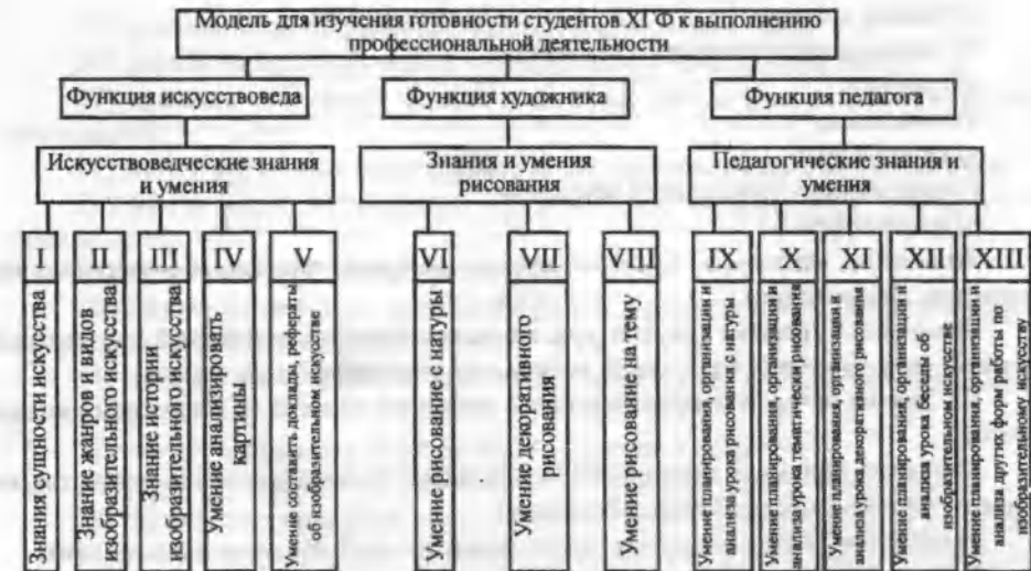
Рис. №3. Модель учителя изобразительного искусства

Осознание цели придаёт учебно-воспитательному процессу в вузе организованный характер. Студенты осознают, какие знания и умения им необходимо усвоить при