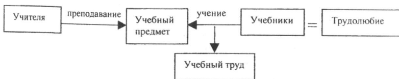
Рис. №1 Модель формирования трудолюбия в процессе учебного труда

Учебный труд в процессе учебно-воспитательной работы, занимая большую часть времени учащихся, оказывает огромное влияние на формирование у них нравственно-трудовых качеств, в числе которых ведущее место занимает трудолюбие.