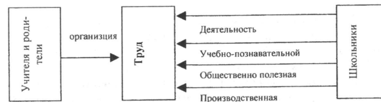
Рис. №2 Модели формирования личности в процессе трудовой деятельности

Однако, труд может принести педагогическую пользу лишь тогда, когда он рассматривается как часть общей системы. К такому выводу пришел талантливый педагог А. С. Макаренко.