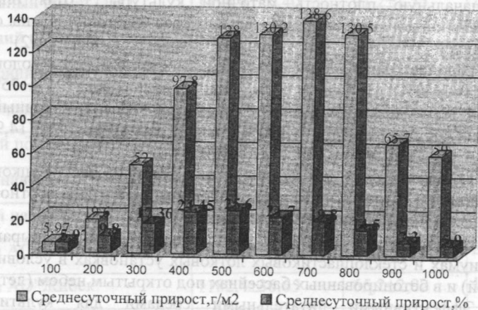
Рис.3. Влияние плотности посева на продуктивность Wolffia arrhiza (среда из куриного помета, 2г/л)

Плотность маточной культуры вольфии на 1 м 2 водной поверхности при глубине воды 15-25 см в большинстве случаев составила 400-600 (редко 700) г сырой биомассы (рис.3). При низкой плотности культуры (100-300 г/м 2 ) бассейны засорялись сине-зелеными, зелеными и диатомовыми водорослями (виды родов Scenedesmus , Ankistrodesmus , Stigeoclonium , Oscillatoria , Amphora , Cymbella , Navicula ). При высокой плотности (800-1000 г/м 2 ) рост вольфии задерживался, выход биомассы с единицы площади постепенно снижался. Это, видимо, обусловлено недостаточностью солнечного освещения.