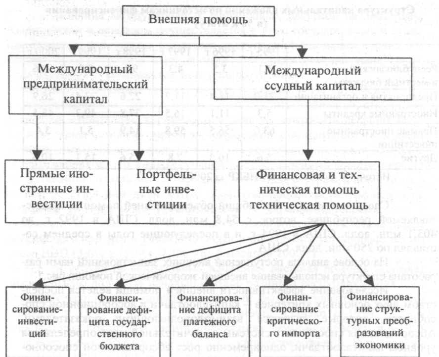
Схема 1. Структура внешней экономической помощи КР.

Уравнение рентабельности займа, а точнее, неравенство будет выглядеть так: