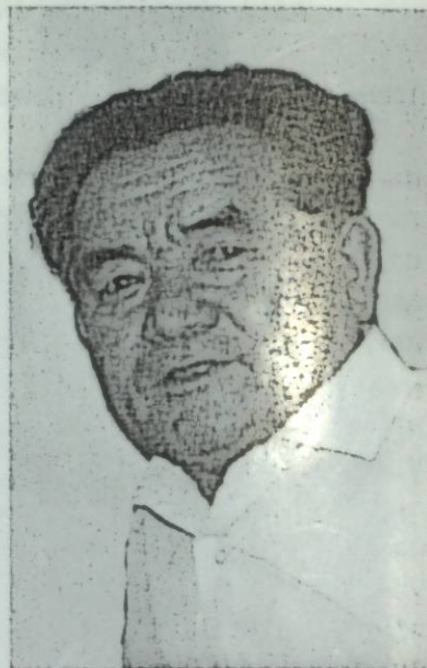
Абдырахман Аралбаев, белгилүү журналист, катормочу