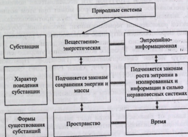
Схема связи триады важнейших пар, образующей основы мироздания.

Таким образом, две субстанции природных систем связаны с двумя формами существования материи – пространством и временем. Выше была показана теснейшая их связь с двумя началами термодинамики. Эти фундаментальные стороны природных систем образуют три важнейшие пары основ мироздания (схема). Каждая из них состоит из стабильной, консервативной и мобильной, изменчивой, текучей частей. Эта Великая Триада Пар определяет самые главные свойства материи. Все другие характеристики и связи являются вторичными по отношению к ним и определяются законами, подчиненными им.