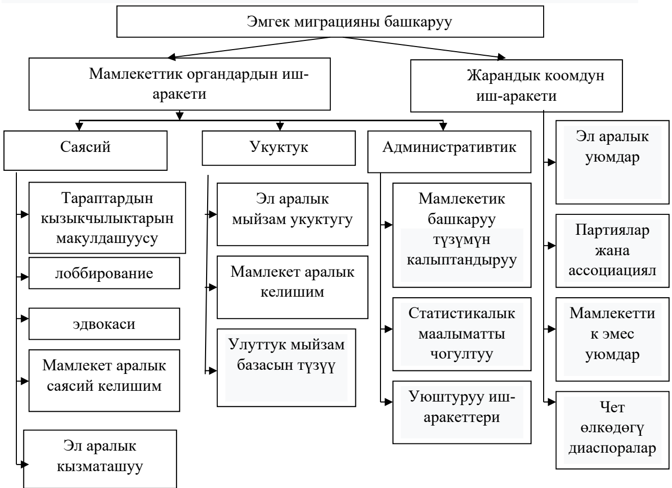
Сүрөт. 3.1. Эмгек миграциянын башкаруу процессинин модели.

процесстерин башкаруу жана жөнгө салуу тутумунун ар кандай элементтеринин өз ара аракеттенишүүсүн жана өз ара көз карандылыгын чагылдырат.