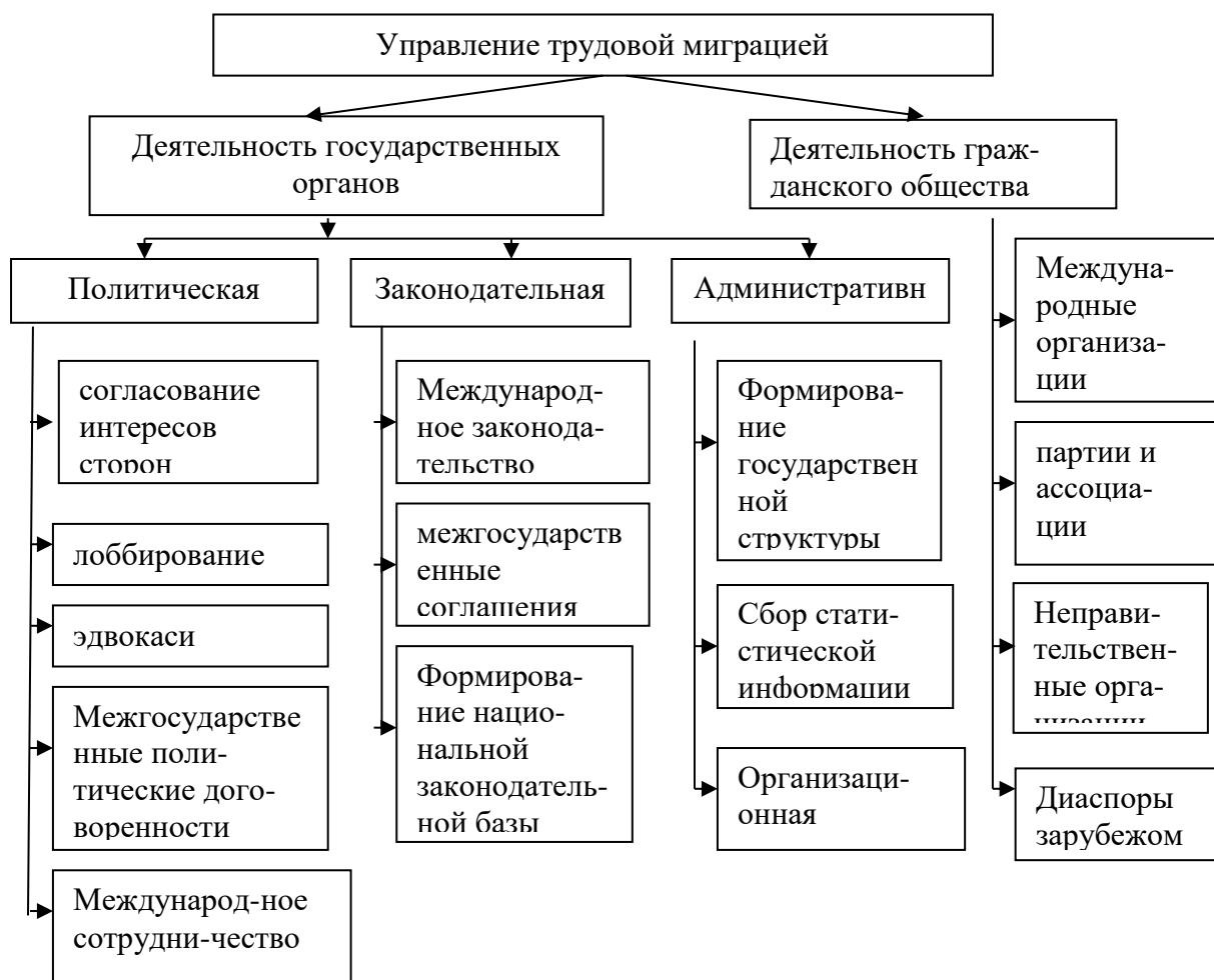
Рис. 3.1. Модель управления процессами трудовой миграции.

Итак, искать пути совершенствования государственных правовых и организационных механизмов регулирования миграционных процессов и защиты трудовых мигрантов Кыргызстана в Казахстане, следует в системе управления трудовой миграцией, в ее структуре и основных направлениях, которые и определяют сам процесс трудовой миграции. Такая предлагаемая модель диссертантом, схематично представлена на рисунке 3.1.