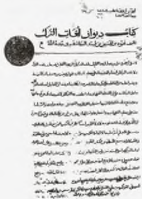
«Дивандын» жалгыз кол жазмасынын 1-бети.