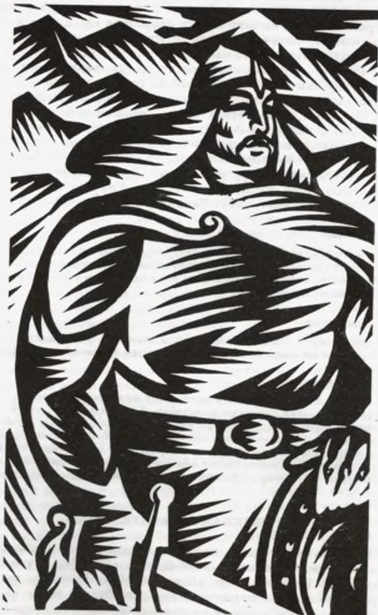
Б. Жумабаев. Семетей.