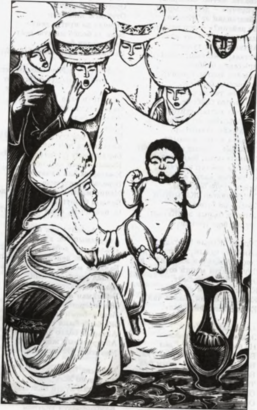
Т. Т. Герцен. Манастын төрөлүшү.

Каалап туруп тогузду ал, Төөдөн алгын төртөөнү; Төрт түлүк малдан төрт тогуз, Балтам, сага жетеби? Калганы болсо, Акбалтам, Катындардан калып ал. Кыз балдардан кымтып ал. Келиндерден кетип ал, Сүйгөнүндөн сүйрөп ал, Каалаганың кармап ал, Жээк жергемен жетип ал. Жетер бекен айтканым, Сенин сүйүнчүңө, Балта чал?»