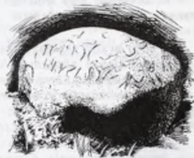
Таш бетине чегилген жазуу.