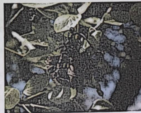
Сүрөт 3. Илдетке чалдыккан мөмө

Жабыркаган жаш мөмөлөрдө күрөң же кара түстө тактар пайда болуп, мөмөлөр кургап калат. Башында мөмөлөр боз жашыл болуп кийинчерээк карайып мумия сыяктуу катып бактан түшпөй бутактарда кала берет. [2]