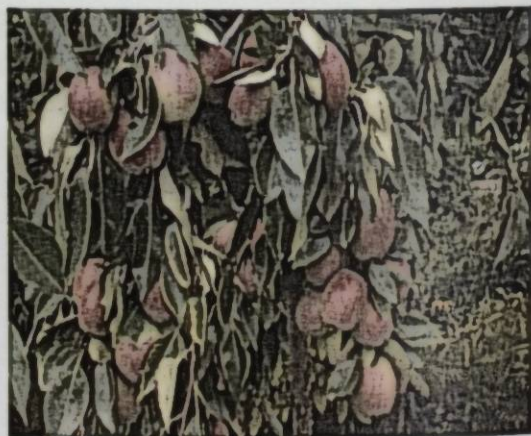
Рис.7 Сорт груши Майская

Автором данного сорта является И. А. Чистухин. Дерево среднерослое, с овальной кроной. Ветви отходят от ствола под узким углом, под тяжестью плодов могут наклоняться вниз и требуется опора.