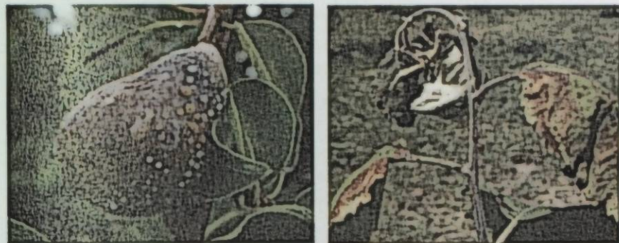
Рис. 4. Вытекание экссудата на плодах и побегах

На дереве инфекция распространяется сверху вниз, т. е. от однолетних приростов к более взрослым ветвям и штамбу. На ветвях и штамбе болезнь проявляется в виде пятен. Кора в местах поражения размягчается, вздувается и растрескивается. Из пораженных плодов и побегов тоже вытекает экссудат. Эпидермис пораженных мест отслаивается, выделяющийся экссудат образует пузырьки. Опооясывание язв, образующихся вокруг ветви или штамба, приводит к отмиранию всей части растения, расположенной выше места поражения.