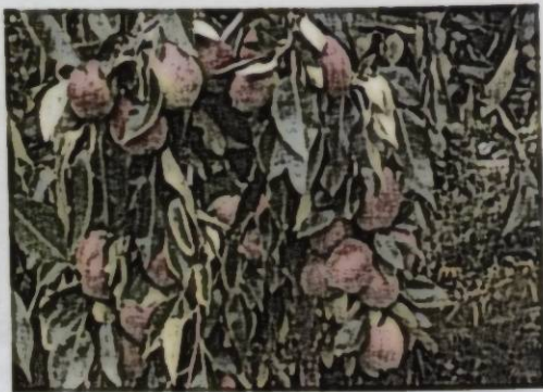
Сурот 7. Алмуруттун Майская сорту.

Алмуруттун Майская сорту - Киргизская зимняя деген ат менен таралган сорт Кыргыз Дыйканчылык ИИИинун Пржевальск сынак борборунда чыгарылган. Бул сорттун автору И. А. Чистухин. Дарагы орто бийиктиктеги, бак келбети (крона овальная) сүйрү формада. Бутақтары өзөгүнөн тар бурч менен тике өсөт, мөмөлөрүнүн салмагы менен ылдыйга ийилип калат, тирөөч керектелет.