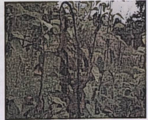
Рис. 2 Поражение побегов

Листья заражаются через естественные отверстия листа - устьица, или различного рода ранки. По краям пораженного листа, вокруг главной жилки или между боковыми жилками появляется коричневые пятна. Со временем пятна увеличиваются и охватывают всю листовую пластинку.