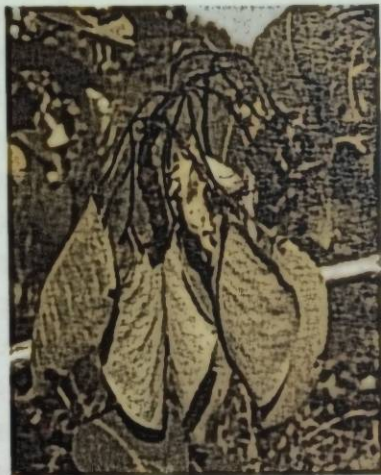
Сүрөт 1. Илдетке чалдыккан гүл тобу

Мөмөлүү өсүмдүктөрдөн: алмурут, бий алма, долоно, алма оорууга катуу чалдыгары байкалат. Мөмөлүү өсүмдүктөрдүн: гүлдөрү, жалбырактары, өркүндөрү, бутактары, өзөгү (штамбы), тамырлары, мөмөсү оорууга чалдыгат. Адатта, оорунун алгачкы белгилерин жазында жалгыз гүлдөрдө же гүл тобунда байкоого болот. Алгач оорууга чалдыккан гүлдөр соолуп, анан тез кургап күрөң түскө ээ болуп, көп учурда бакта жыл аягына чейин түшпөй калат.