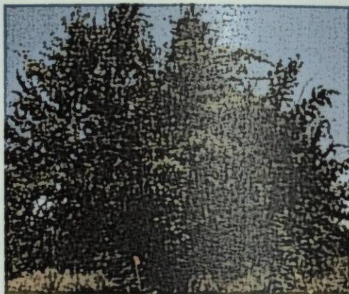
Рис.5 Сорт груши Красивая 2016г.

Сильно пораженное дерево выглядит, словно опаленное огнем, поэтому болезнь и называется ожогом. Пораженные бактериальным ожогом деревья не устойчивых сортов в течении 3-4 лет могут высохнуть. В наших наблюдениях 2014 года, начавшееся поражение у таких неустойчивых сортов груши, как Янтарная, Деканка краснокутская, Красивая, Девиолен и Краснокутская зимняя, закончилось в 2017 году полной гибелью.