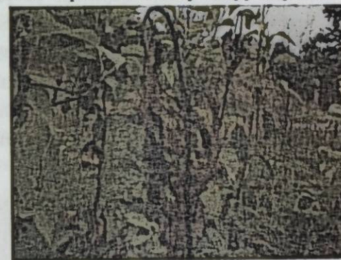
Сүрөт 2. Илдетке чалдыккан өркүн

Илдетке чалдыккан бутактарда жана өзөктөрдө (стволе) оорунун өрчүшү жогорудан жаш бутактын учунан башталып акырындык менен кабыктын паренхимасы аркылуу дарактын түбүнө өтөт. Илдетке чалдыккан өркүндөр карамтыл-жашыл болуп, анан иймек сыяктуу ийилип жана карайып, куурап калат. Өркүндөр «койчунун таягы» деп аталган формага ээ болот.