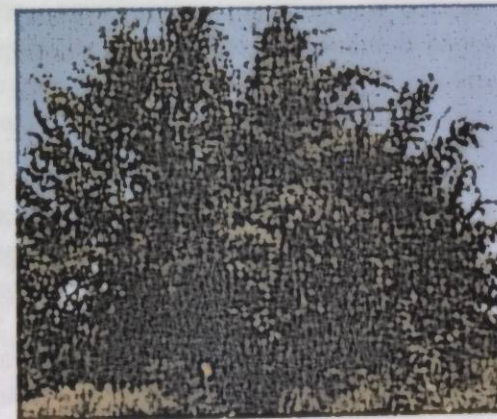
Сүрөт 5. Алмуруттун Красивая сорту 2016-ж.

Биздин байкоолорубузда 2014-жылы ооруга чалдыккан алмуруттун туруксуз сорттору Деканка Краснокутская, Красивая, Девиолен жана Краснокутская зимняя 2017-жылы толук кургап калуусу менен бүттү.