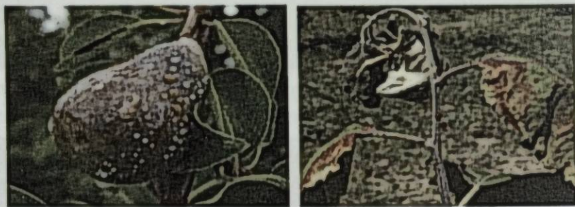
Сүрөт 4. Мөмөдөгү жана өркүндөн экссудаттын чыгышы

ал жерде ыйлакчалар пайда болот. Илдетке чалдыккан бактын түбүндө же бутактарда жарат шакек түрүндө бутакты ороп таралса, анда ошол жеринен үстүнкү бөлүгү толугу менен куурап калат. Пайда болгон жаракалардан алгач түзсүз суюктук бөлүнүп чыгат, кийинчерээк күрөң түскө боёлот. Ал суюктук экссудат, ичинде көп сандаган бактериялар кездешет. Ошондой эле илдетке чалдыккан мөмөлөрдөн жана өркүндөрдөн да экссудат бөлүнүп чыгат.