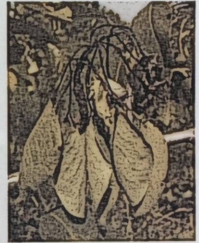
Рис. 1 Поражение соцветия

В сильной степени заражение отмечается на плодовых деревьях: груше, айве, боярышнике, яблоне. У плодовых деревьев поражаются: цветы, листья, побеги, ветви, штамбы, корни, плоды. Обычно, первые признаки заболевания можно обнаружить весной во время цветения на одиночных или всех цветках в розетке. Пораженные цветки сначала вянут, затем быстро засыхают, приобретая коричневый цвет, и чаще всего остаются на дереве в течение всего года. Болезнь распространяется на цветоножку, которая сначала становится темно-зеленой, затем чернеет.