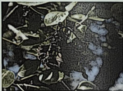
Рис. 3 Поражение плода

У пораженных молодых плодов так же появляются коричневые или черные пятна, они засыхают и остаются висеть на плодоножках. Плоды вначале выглядят серо-зелеными, затем чернеют, мумифицируются, но остаются висеть на побегах. [2]