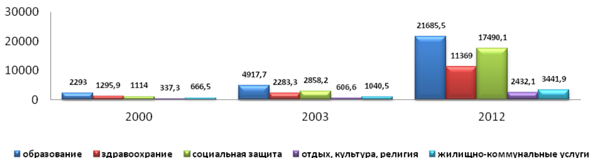
Рис. 2.3 Расходы госбюджета Кыргызстана на социально-культурную сферу (млн. сомов)

Таким образом, в наибольшей степени увеличились расходы на социальную защиту, которые в 2000 г. составляли 48,6% затрат на образование, а в 2012 г. – уже 92,3%. Значение этой тенденции противоречиво. С одной стороны, регулярное увеличение размеров пенсий и пособий безусловно является правильным решением исходя из принципов социальной справедливости. С другой стороны, эти данные свидетельствуют и о том, что в нашей республике очень низкий уровень жизни, что вынуждает граждан обращаться за помощью к государству.