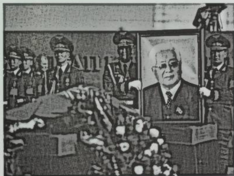
Акыркы сапарга узатуу. Бишкек шаары, 2015-жыл