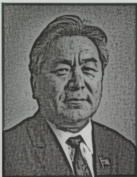
Т. Усубалиев. 1970-жылдары