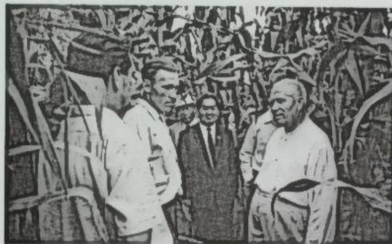
Эстен кеткис Н. Хрущев Кыргызстандын жүгөрү талаасында