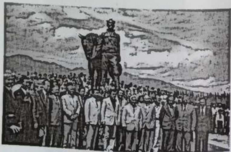
Ысык-Көлдө орус саякатчысы П. П. Семёнов-Тянь-Шанскийдин эстелигин ачуу. 1982-жыл