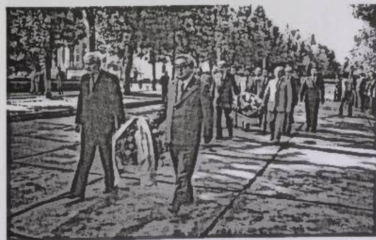
КПССтин БК Башкы катчысы К. Черненко жана Т. Усубалиев