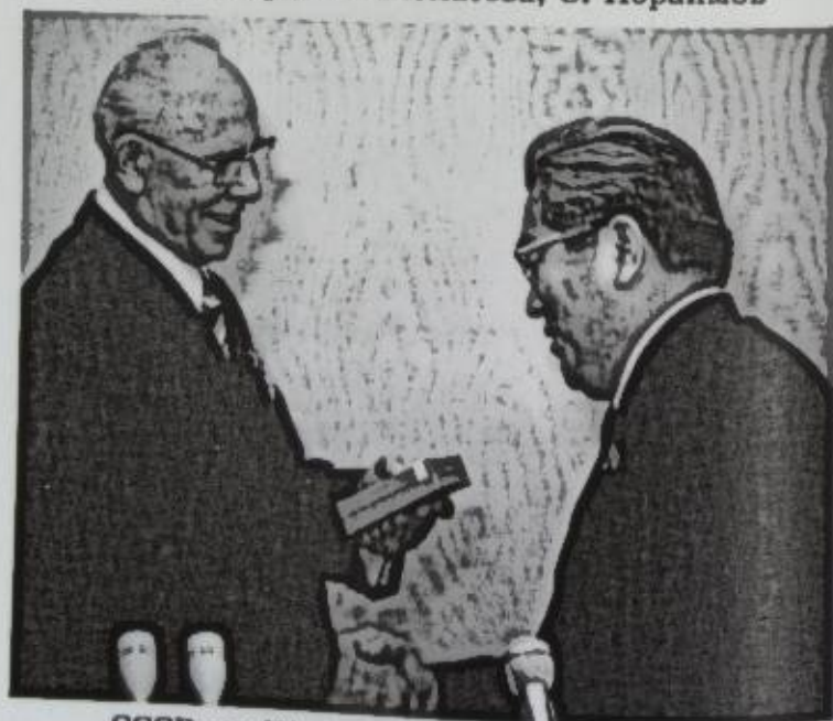
СССРдин Жогорку Советинин төрагасы Н. Подгорный Усубалиевге Октябрь революциясынын орденин тапшырууда, 1971-жыл