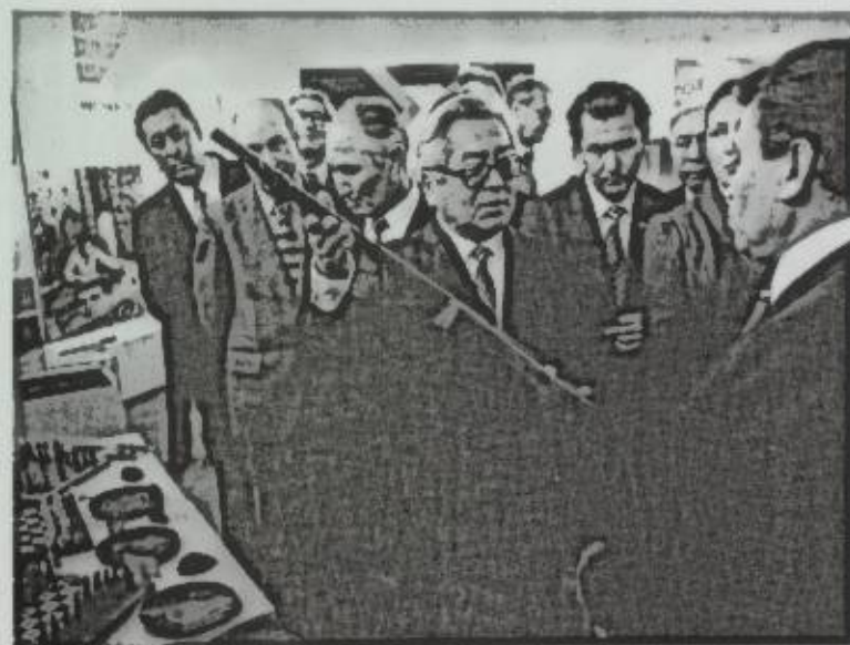
В. И. Ленин атындагы жаңы музейде. Экспонаттарды көрүү