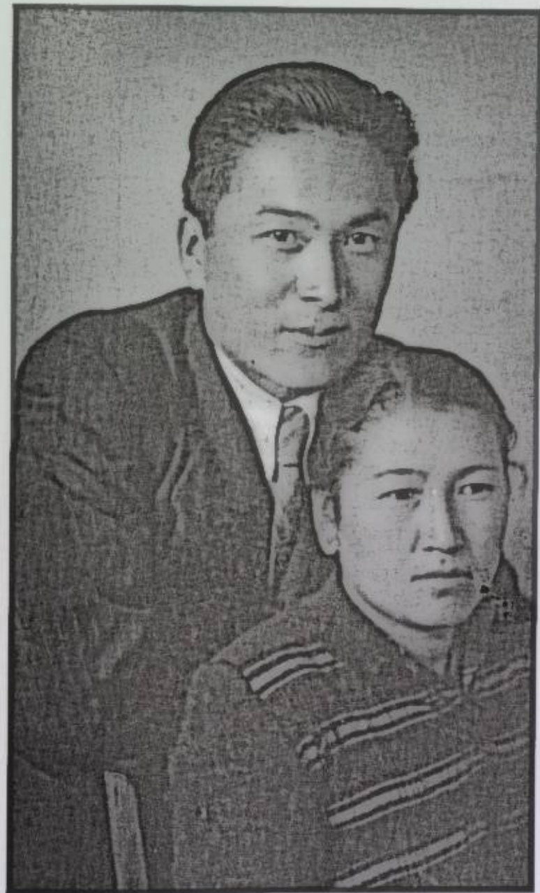
Жубайы Гүлжаке менен. Москва шаары