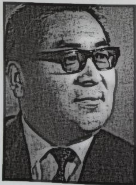
Т. Усубалиев. 1960-жылдары