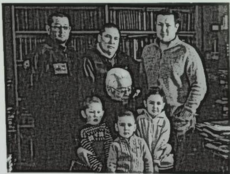
Неберелери менен баарлашуу