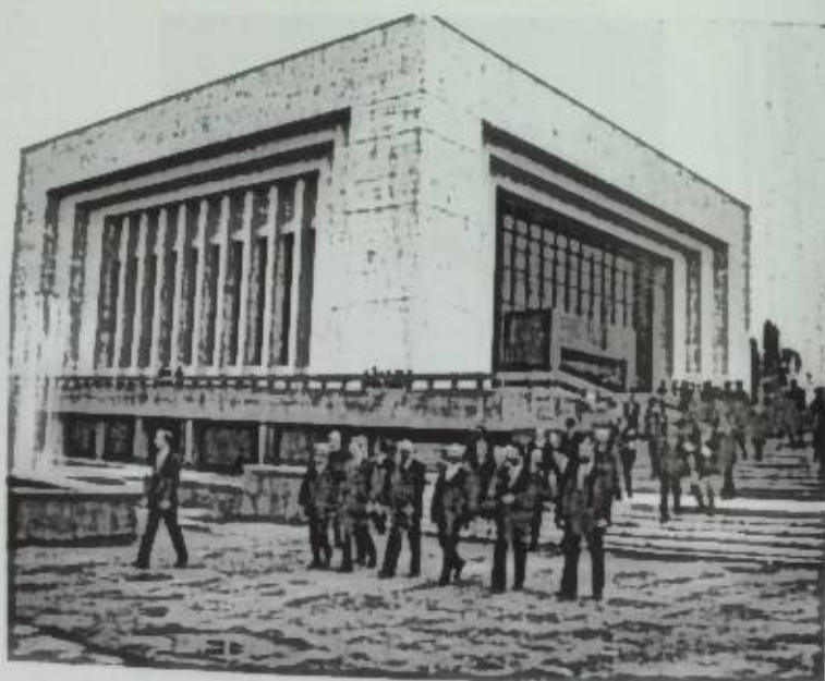
В. И. Ленин атындагы Борбордук музейдин Фрунзедеги филиалы ачылды. 1979-жыл