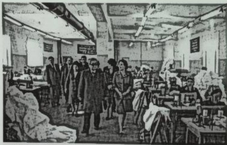
Жеңил өнөр жайы баш көтөрүүдө. ВЛКСМдин 40 жылдыгы атындагы фабрикада