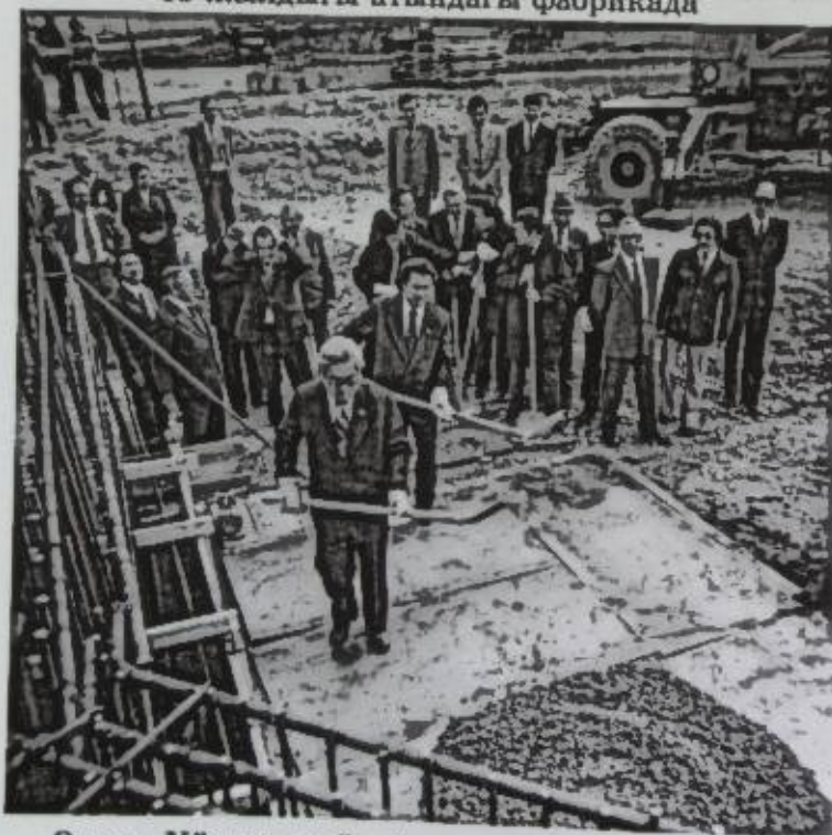
Өкмөт Үйүнүн пайдубалын түптөө. 1979-жыл