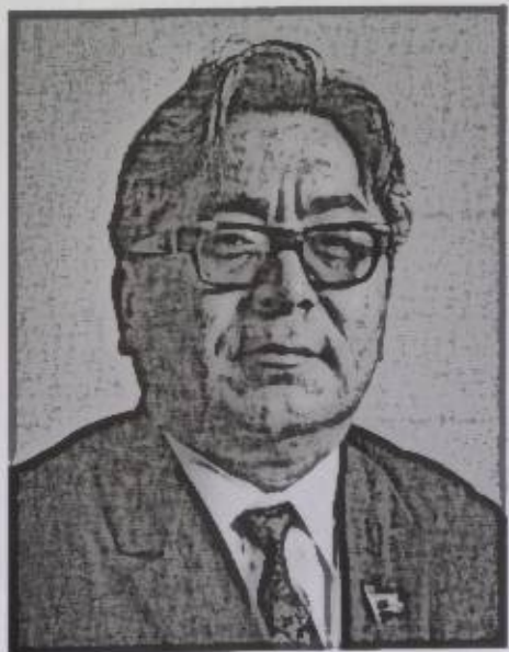
Т. Усубалиев. 1980-жылдары