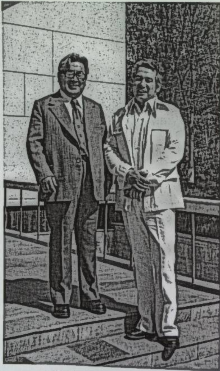
Т. Усубалиев менен Ч. Айтматов

Ал жылдардагы республиканын биринчи жетекчиси Турдакун Усубалиев бул узакка жүрүүчү процесстерде эң маанилүү роль ойноп, Кыргызстандын «Күмүш кылымынын» белгилүү маданият ишмерлеринин баарын ар тараптан колдогон. Ооба, алардын айрымдары менен анын проблемалары болгон, тагыраак айтканда бир катар маселелер боюнча көз караштардын төп келбегендиги байкалган – мындай да болгон. Кыргыз адабиятынын классиги Түгөлбай Сыдыкбеков менен ошондой болгон, ал Усубалиевдин жетекчилик стилин гана эмес, чоң союздун саясатын да ачык сындаган, бул жөнүндө кийинчерээк айтып беребиз. Көз караштары боюнча Сыдыкбеков совет бийлигин Кыргызстандын маданий-экономикалык кайра жаралышындагы ролун эч качан четке какпаганы менен ал чыныгы диссидент болгон. Классик менен тилдик курулуш, тарыхый мурас маселелери боюнча талашып, 1949-жылдагы адабият боюнча сталиндик сыйлыктын лауреатынын чырларына чыдап, биринчи катчы ошого карабастан атактуу романчыга кандайдыр бир куугунтуктоолорду же басым жасап өлкөдөн чыгарып жиберүүгө далалат кылган эмес. Ооба, ал кыргыз адабиятынын алдындагы эмгеги үчүн Сыдыкбековго Социалисттик Эмгектин Баатыры жогорку наамы ыйгарууга же Ленин ордени берүүгө каршы болгон. Бирок атайылап өч алуу же кандайдыр бир соттук куугунтуктоо болгон эмес. Ал бул республикада бардыгы, анын ичинде маданият үчүн да жооптуумун деп туура эсептеген жана кийин ал үчүн күнөө коюшкан маданият ишине айрым бир кийлигишүүсү авторитариялык өлкөдөгү башкаруунун жалпы принциптеринен келип чыккан.