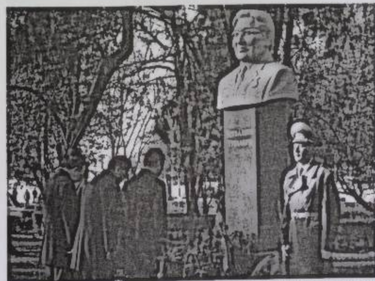
Бишкек шаарынын мемориалдык гүлбакчасындагы Т. Усубалиевдин бюсту