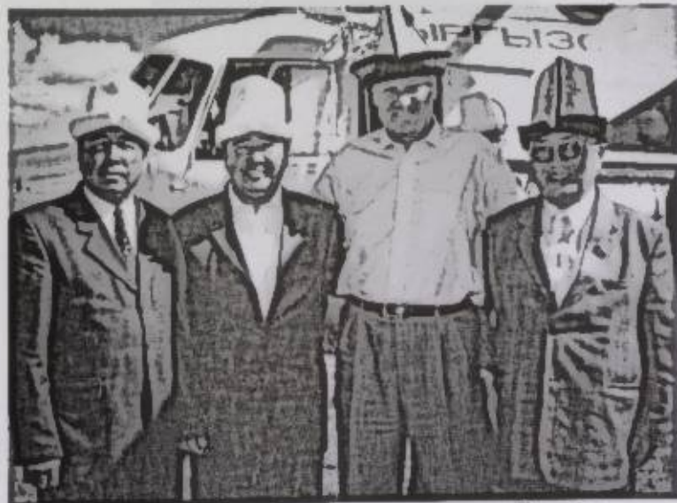
Жаңы заман, жаңы жолдоштор: Россия Федерациясынын биринчи Президенти В. Ельцин менен Соң-Көлдө. 2002-жыл