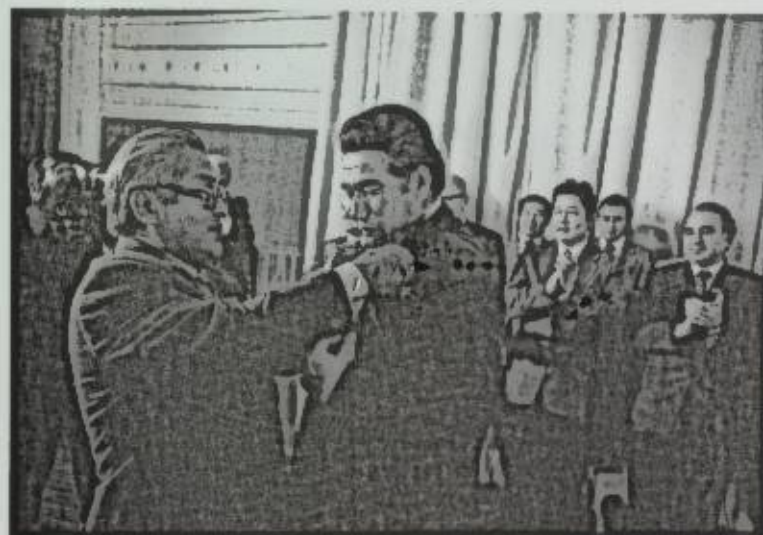
Т. Усубалиев Ч. Айтматовго Социалисттик Эмгектин Баатырынын алтын жылдызын тапшырууда. 1978-жыл