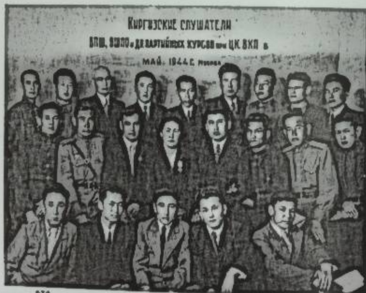
Жогорку партиялык курстун угуучулары. Москва, 1944-жыл