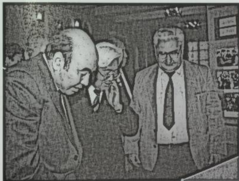
Көз карандысыз Кыргызстандын туңгуч Президенти А. Акаев менен