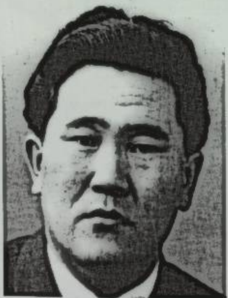
Кыргыз ССРинин Министрлер Советинин төрагасы С. Ибраимов