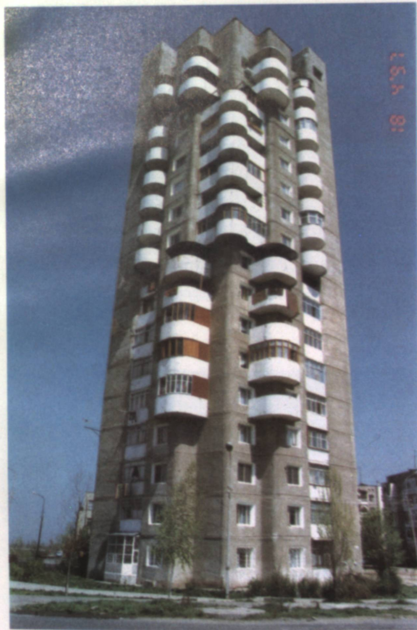
10-й микрорайон. Жилой дом.