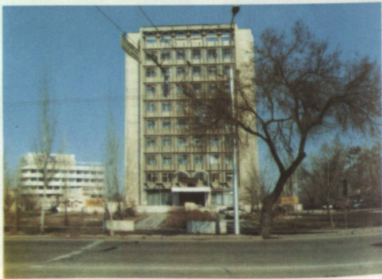
Административно-производственное здание на проспекте Ленина.