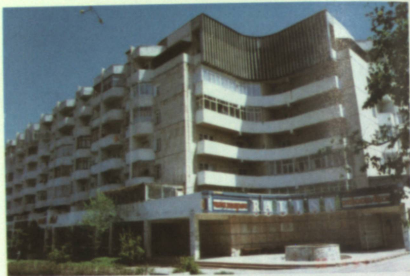
Жилой дом на проспекте Манаса.