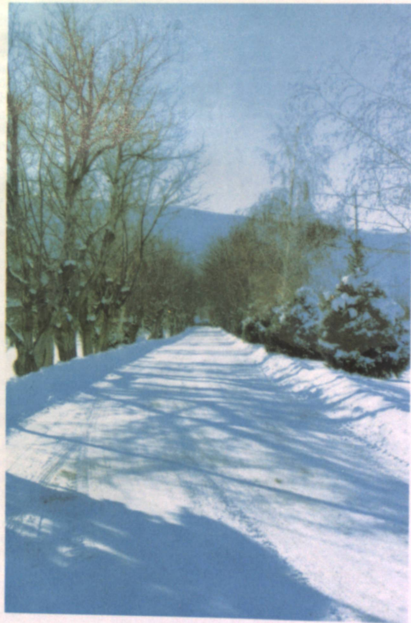
Аллея ореховых деревьев.

Такого рода факты оказались не единичными. А что показала проверка в дальнейшем? Неправомерные действия райкомов партии. Если председатель колхоза или директор совхоза не соглашались с суждением первых секретарей райкомов и обкомов партии по тем или иным вопросам, возражали им в чем-либо, то такие руководители под всякими предлогами освобождались от работы. Происходила частая, нередко, ничем необоснованная смена руководителей хозяйств. Такие факты во многих случаях оказывались вне поля зрения ЦК. Мы решили положить конец этой чехарде в подборе и расстановке руководящих кадров в сельском хозяйстве. Как я уже отметил, все руководители колхозов, совхозов и других межхозяйственных предприятий были включены в номенклатуру бюро ЦК. Это означало, что они только по постановлению бюро ЦК утверждались в должности и освобождались от занимаемых должностей, принятому на