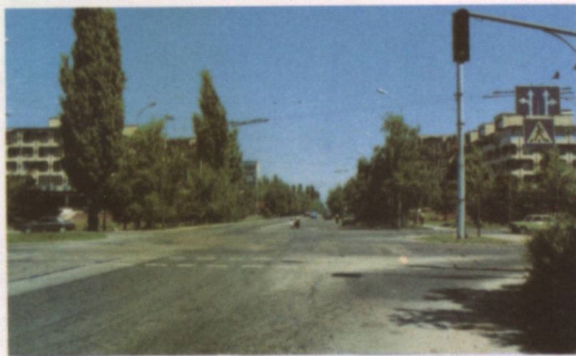
Южные ворота столицы.