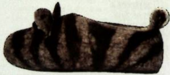
1-фигура. Жалпы көрүнүшү Фиг. 1. Общий вид