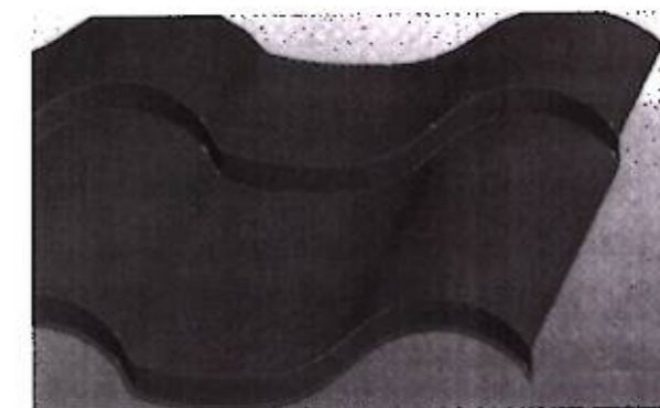
4-фигура. Жаба турган толкуну менен каптал кырынын фрагменти Фиг. 4. Фрагмент бокового края с накрывающей волной