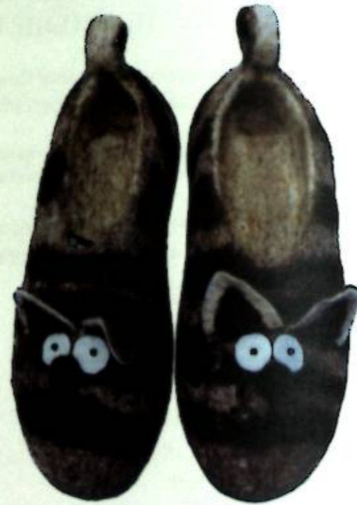
2-фигура. Үстүнөн көрүнүшү Фиг. 2. Вид сверху