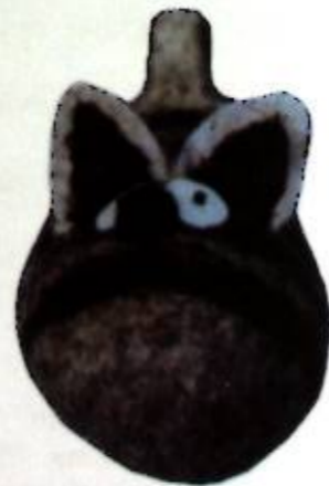
3-фигура. Алдынан көрүнүшү Фиг. 3. Вид спереди