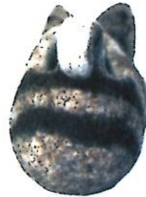
4-фигура. Артынан көрүнүшү Фиг. 4. Вид сзади