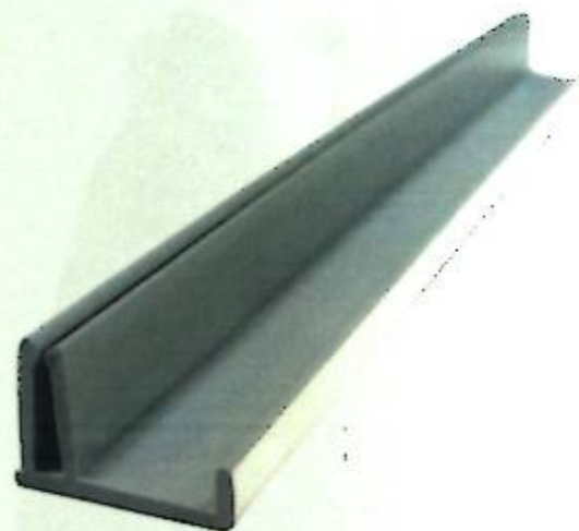
1-фигура. Жалпы көрүнүшү Фиг. 1. Общий вид

– выполнением лицевой стороны профиля, являющимся элементом, сопряженным с одной стороны со стеной и отходящим от нее вверх под прямым углом бортиком, примыкающим к потолку с другой стороны.