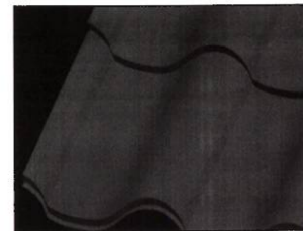
3-фигура. Жабуучу толкуну менен каптал кырынын фрагменти Фиг. 3. Фрагмент бокового края с накрываемой волной