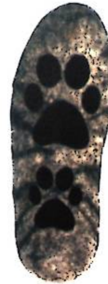
5-фигура. Астынан көрүнүшү Фиг. 5. Вид снизу