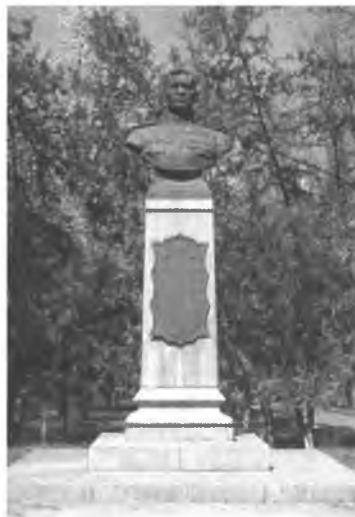
Т. Бегелдиновдун бюсту. Бишкек ш.