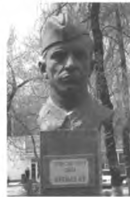
Н. Ананьевдин бюсту. Бишкек ш.