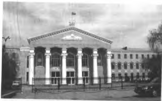
Ж. Баласагын атындагы Кыргыз улуттук университети.

Эгемендүү Кыргызстанда билим берүү тармагы азыркы кезде социалдык чөйрөнүн эн эле массалык тармагы болуп калды. Бул тармакта 1 млн 200 миң киши алек болууда. Булардын 1 млн 100 миңи – мектептерден жогорку окуу жайларына чейин билим алуучулар, ал эми 77,5 миңи окутуучулар. Тактап айтканда, Кыргызстандын ар бир төртүнчү адамы окуучу жана