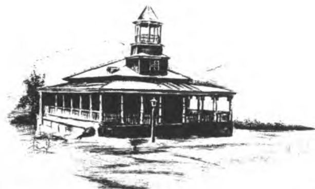
Шабдан баатырдын мечити. Чоң Кемин өрөөнү.

Бул мезгилде калктын саламаттыгын сактоо тармагында да жанылыктар башталган. Адегенде орус аскерлери үчүн лазареттер, кийинчерээк – жөнөкөй адамдар үчүн фельдшердик жай-