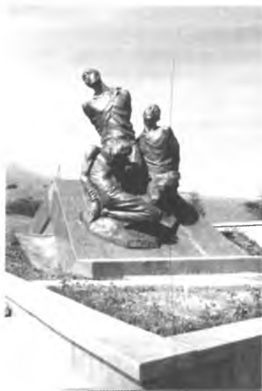
«Ата-Бейит» мемориалдык комплексиндеги эстелик.

Өлкөдө, анын ичинде Кыргызстанда, орногон администрациялык-буйрукчул система, анын массалык жазалоолору социалисттик курулушка өзүнүн оор залакасын, кесепетин тийгизген. Бирок жеке адамга сыйынуучулук, массалык террор совет коомунун маңызын, жалпы элдин куруучулук ишмердигин, СССРдин прогресс жолундагы өнүгүшүн токто-то алган эмес.