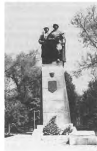
Баатыр комсомолдорго тургузулган эстелик. Бишкек ш.

тыяры менен майданга аттанып, медициналык-санитардык батальондун командири кызматында Москвадан Берлинге чейинки жолду басып өтүп, оор операцияларды тынымсыз жасап, миндеген советтик жоокерлерди ажалдан арачалап калган.