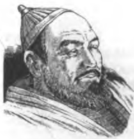
Үмөтаалы Ормон уулу.

Сарыбагыш уруусунун чоң манабы Үмөтаалы Ормон уулу да орус бийлигине каршы ачык күрөшкөн. Ал орус аскерлерин бириндетип талкалап, Ата журттан сүрүп салуу максатында 1863-ж.