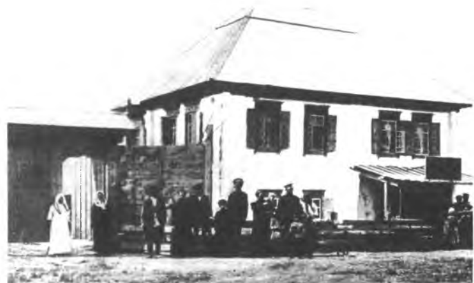
Бай орустун турак жайы. XX к. башы. Чүй өрөөнү.

Россияга каратылгандан кийин Кыргызстандын калкынын саны бир кыйла көбөйгөндүгү байкалат. 1897-ж. Бүткүл Россиялык эл каттоо боюнча Кыргызстандын жаңы администрациялык чегинде 663 миң адам жашаган. Бул 1865-ж. салыштырганда 116 миң адамга көптүк кылган, өсүш 21,2 проценти