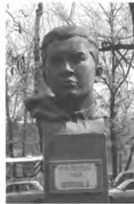
Д. Шопоковдун бюсту. Бишкек ш.

Командованиенин тапшырмасын үлгүлүү аткаргандыгы үчүн 316-аткычтар дивизиясы 8-гвардиялык деген наам алып, Кызыл Жылдыз ордени менен сыйланган. Волоколамск районундагы, Гусинёво деген кыштактын жанында 1941-ж. 18-ноябрда И. В. Панфилов курман болгон. Өлгөндөн кийин ага Советтер Союзунун Баатыры деген наам берилип, ысымы өзүнүн дивизиясына ыйгарылган.