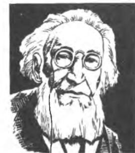
П. П. Семенов-Тянь-Шанский.