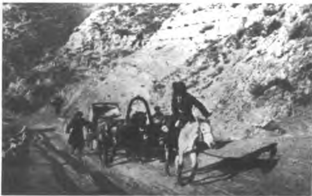
Кыргызстандагы алгачкы почта жолунда. Боом капчыгайы.

Кыргызстанда өнөр жайдын өнүгүшү менен аз санда болсо дагы жумушчу табы пайда болгон. Алардын катарын келгин жана жергиликтүү элдердин кол өнөрчүлөрүнүн жакырланган бөлүгү түзгөн. Жумушчулардын жогорку квалификациялуу бөлүгү Россиянын борбордук бөлүгүнөн келген жумушчулар болгон. Ишканалар кустардык жана жарым кустардык мүнөздө болгондуктан, жумушчулар чачыранды болушкан. Бирден бешке чейин жумушчулар эмгектенген ишканалар көп эле. Ири делип эсептелген ишканаларда 16дан 40ка чейин жумушчулар иштеген. 1913-ж. кустардык өнөр жайда 12,6 миң, ал эми фабрика-завод тибиндеги ишканаларда 1,9 миң жумушчу болгон. 1913-ж. Кыргызстандын өнөр жай ишканаларында 2545 жалданма жумушчу иштеген. Кийинки жылдары ири ишканаларда иштеген жумушчулардын саны кыйла көбөйгөн. Алсак, 1917-ж. Кызыл-Кыя кенинде 1,2 миң, Сүлүктүдө – 1070, ал эми Чүй сугат системасында 200 адис жумушчулар эмгектенген. Жалпы алганда өнөр жайында эмгектенген жумушчулардын саны 10 миңге жеткен. Мындан тышкары айыл чарбасында жалданып иштеген жумушчу-батрактардын саны 20 миңдей болгон. Алар кулактардын, бай-манаптардын чарбаларында иштешкен. Алардын көпчүлүгү жергиликтүү калктын жакырданган бөлүгү