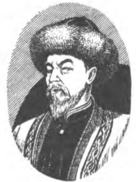
Калыгул Бай уулу.

Чыгыш поэзиясынын бул түрүн өркүндөткөн кыргыз ойчулдарынын дагы бири Арстанбек Буйлаш (Бойлош) уулу (1824–1878-жж.) болгон. Ал комуздагы күүлөрү, обондуу ырлары менен да эл ичинде атагы чыккан. Анын «Тар заман» аттуу негизги чыгармасында коомдук, саясий, турмуш-тиричилик, кыскасы адам менен коом жөнүндөгү тарыхый конкреттүү шарттарга байланыштуу ар түрдүү мазмундагы поэтикалык жыйынтыктар берилген. Өзү жашаган кыргыз коомундагы саясий турмушка кайрылып Арстанбек Кыргызстандын Россия букара-чагына өтүшүн анчейин жактырган эмес. Андан көрө Чыгыш Түркстанда түзүлгөн Жакып бектин Жетишаар мамлекетине ко-