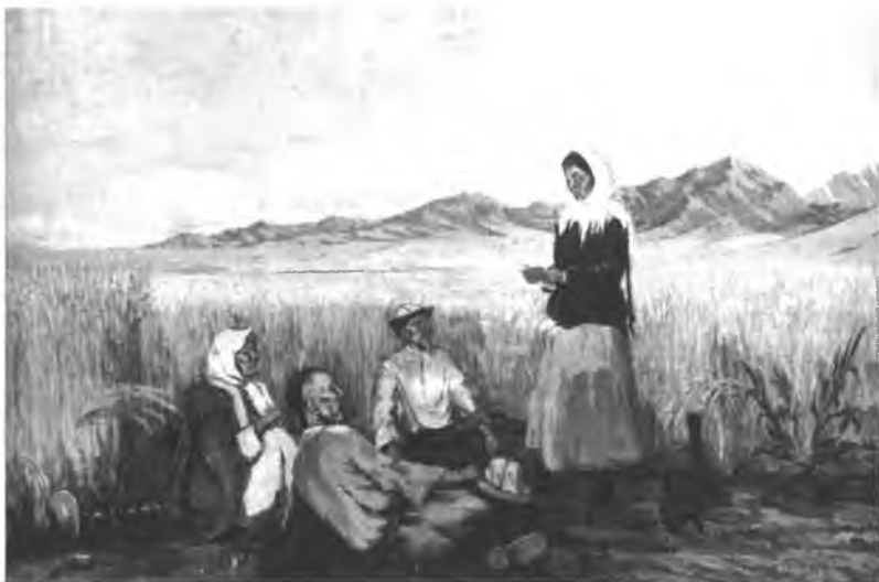
«Фронттон кат». Г. Айтиев.

1951-ж. партия менен Совет өкмөтүнүн башкы жетекчилигинин көрсөтмөсү менен элдердин улуттук эпостору сынга алына баштаган. Кыргыз элинин руханий турмушунун туу чокусу болгон «Манас» эпосуна да «элге каршы багытталган, динчил, эзүүчүлөрдүн кызыкчылыгын көздөгөн, согушту жактаган» чыгарма катары тыюу салынат. Бирок кыргыз интеллигенциясы өздөрүнүн эпосу жөнүндөгү бул чечимге макул болгон эмес. Бас-