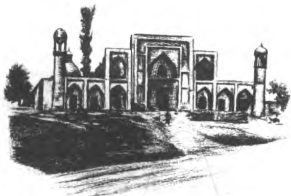
Алымбек-датканын медресеси. XIX к. Ош ш.

Ошентип, Молдо Кылычтын чыгармачылыгынын негизин адамдын, коомго болгон көз карашын кеңейтүү, адамдарды биринчи кезекте руханий, моралдык жактан тарбиялоо түзгөн.