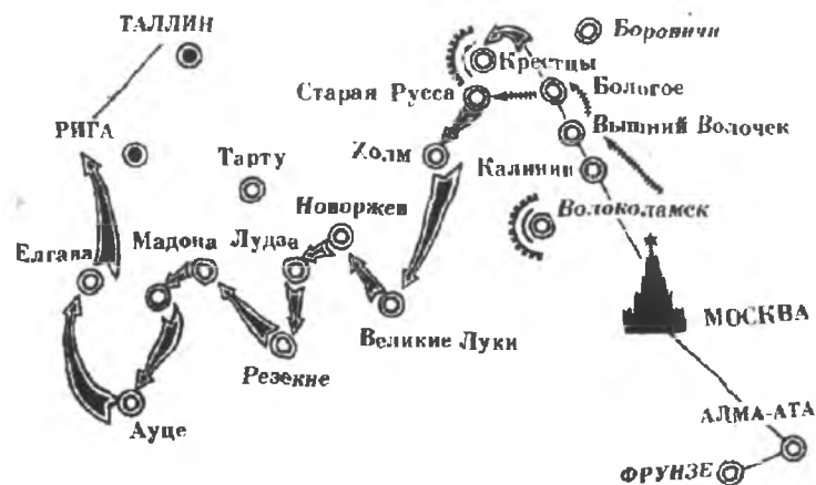
Панфилов дивизиясынын жоокердик жолу.