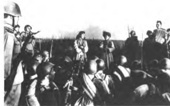
Кыргызстандык артисттер Панфилов дивизиясынын аскерлерине концерт берүүдө. 1943-ж.

Фрунзе областынын Ворошилов районунун Ленин атындагы колхозунун колхозчулары 1941-ж. октябрда коргонуу фондусуна өздөрүнүн менчик бодо малынан бирден семиртип берүү демилгеси менен чыгышкан. Ушул эле райондун «Кызыл Аскер» колхозунун мүчөлөрү колхоздун 50 күлүк атын фронтко берүүнү чечишкен. Бул демилге республикага тез тараган. Тянь-Шань областынын Кочкор районунун колхозчулары 835 жыл-