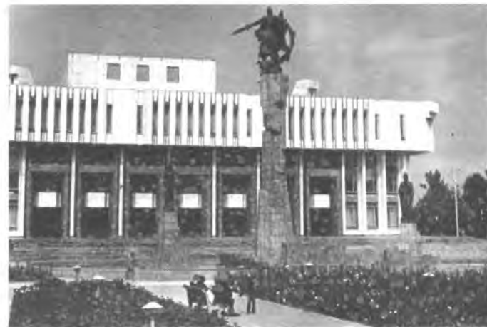
Кыргыз Улуттук филармониясы.

Эгемендүүлүктүн өткөн он жылында Кыргызстанда музей иши бир кыйла жанданды. Республиканын 7 мамлекеттик музейи Эл аралык музейлер кенешине мүчө болушту. Панфилов районунда А. Осмоновдун, Алай районунда Курманжан датканын, Лейлек районунда А. Орозбековдун, Ош шаарында «Улуу Жибек жолу», Нарын шаарында тарыхый-край таануу, Таласта «Манас-Ордо» Аламүдүн районунда «Ата-Бейит» музейлери иштей баштады.