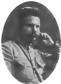
М. В. Фрунзе.

да бай дыйкандар колдогон ак гвардиячылар Пржевальскиге чабуул койгон. Шаардын эли Токмоктон, Верныйдан кызыл аскерлер жардамга келгиче бир жума бою шаарды коргогон. 26–27-июлда кызыл аскерлердин биргелешкен күчтөрү козголонуучуларга чечүүчү сокку урган. Козголоңдун активдүү уюштуруучулары Кытайга кире качкан.