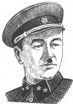
И. В. Панфилов.

Булардын ичинен согушка биринчи болуп Кыргызстандын аскер комиссары генерал-майор И. В. Панфилов командалык кылган 316-аткычтар дивизиясы кирген. Бул дивизия Казакстан менен Кыргызстандын өкмөттөрү тарабынан түзүлгөн. Дивизиянын курамы ушул эки республиканын дыйкандарынан, жумушчуларынан жана кызматкерлеринен турган. Анда казак, кыргыздардан тышкары орустар, украиндер ж. б. улуттардын өкүлдөрү болгон. Москваны коргоо үчүн 1941-ж. ноябрда болгон согушта бул дивизиянын жоокерлери өздөрүнөн төрт эсе күчтүүлүк кылган душман менен кармашкан. Бир ай бою өздөрүнүн чегин бекем кармоо менен дивизиянын бөлүктөрү душмандын 2-танкалык, 29-моторлоштурулган, 11-жана 110-жөө аскерлер дивизиясын талкалап, 9 миң немец солдаттары менен офицерлерин, 80 танканы жана башка куралдарды жок кылышкан.