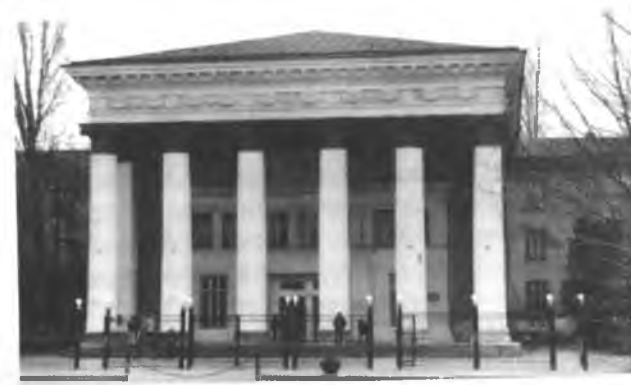
К. И. Скрябин атындагы Кыргыз улуттук агрардык университети.

Кыргыз Республикасынын «Билим берүү жөнүндөгү» мыйзамы боюнча жогорку окуу жайларынын укуктары бир кыйла кеңейген. Бул окуу жайларында адистер алардын жөндөмдүүлүгүнө жараша көп баскыч менен даярдала баштаган. Жогорку окуу жайлары акча каражаттарын пайдаланууда өз алдынчалыкка ээ болгон. Мамлекеттик эмес окуу жайлар ачыла баштаган. Акы төлөп билим алууга кенири жол ачылган. Жогорку окуу жайлары чет элдик инвестицияларды пайдаланууда кенири мүм-