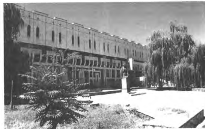
Кыргыз Улуттук китепканасы.

Эл аралык байланыштардын өнүгүшүндө Кыргыз Улуттук китепканасы да көп иш аткарууда. Азыркы күндө анда дүйнө элдеринин 70ке жакын тилдеринде чыккан 6 млрд ашуун түрдүү басылмалар сакталат. Китепкананын фондусун толуктоодо эл