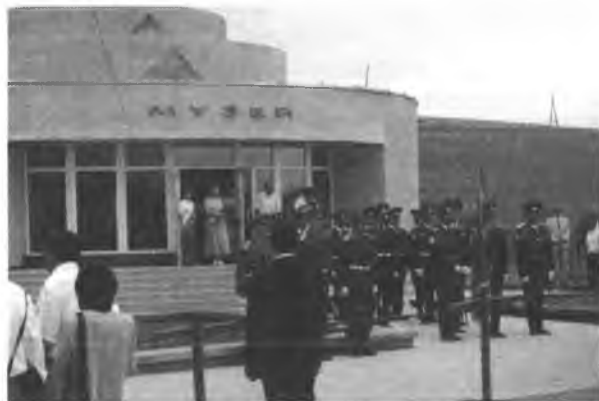
«Ата-Бейит» музейи. Чон-Таш айылы.