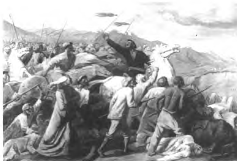
«1916-жыл». (С.Чуйковдун картинасынан.)

1914-ж. башталган дүйнөлүк биринчи согуш, согушка Россиянын катышуусу ансыз деле эзиллип, кыйналып турган колониялык элдин башына түшкөн мүшкүл болгон. Кыргыздар да жалпы элге түшкөн кыйынчылыктан четте калбастан, согушка акча, кийим-кече, атчан аскерлер үчүн кыргыз жылкыларын жөнөтүп турган. 1916-ж. 25-июнундагы падышанын Түркстандын элдеринен аскердик курактагы (19дан 43кө чейинки) эр-