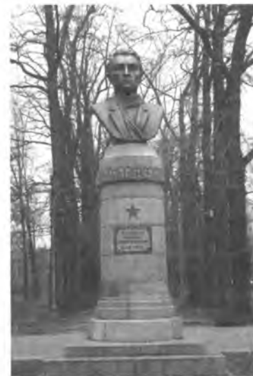
А. И. Иваницындин бюсту. Бишкек ш.

Пишпек уездинде Совет бийлигин орнотуу контрреволюциячыл күчтөрдүн каршылыгына дуушар болуп курч мүнөздө өткөн. 1917-ж. 31-декабрындагы Пишпектин Дубовый паркында 1000ден ашык киши катышкан митинг уезддеги революциялык окуялардын жүрүшүндө бурулуш учур болгон. Митинг большевиктер башында турган бардык революциячыл күчтөрдү чечкиндүү аракетке өтүү үчүн баш коштуруп, Кызыл Гвардия отряддарын түзүү жөнүндө чечим кабыл алган. 1918-ж. 1-январда Пишпектин большевиктери жаны женишке ээ болуп, Пишпек Советинин аскердик жетекчилиги большевиктер менен алмаштырылган. Анын төрагалыгына большевик Г. И. Швец-Базарный шайланган. 1918-ж. 5-январында Пишпек уездинин Советтеринин съезди болуп, бул аймакта Совет бийлиги орногондугун жарыялаган. Февралда Токмок шаарында бийлик Советтердин колуна өтүп, 300 адамдан турган Кызыл Гвардия түзүлгөн. Пишпек уездинде Совет бийлигинин орношу Жети-Суу областынын борбору Верный (азыркы Алматы) шаарында буржуазиянын бийлигин кулатууну бир кыйла жеңилдеткен. 3-мартта Верный да Совет бийлигинин жениши областтын калган аймагында, анын ичинен Пржевальск уездинде Совет бийлигин орнотууда чечүүчү мааниге ээ болгон.