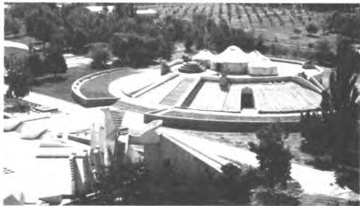
«Манас-айылы» тарыхый-этнографиялык комплекси.

Кыргыздардын этногенезин жана этностук тарыхы тере-нирээк изилдөө үчүн КР УИАнын Тарых институтунун демил-геси менен атайын программа иштелип чыкты. Коомчулуктун өз элинин тарыхына зор кызыгууларын эске алып, програм-манын авторлору кыргыздардын этногенездик жана этностук та-рыхынын проблемаларына чоң көңүл бурушкан. Кыргыздардын тарыхын үйрөнүү жана ага кайрылуу идеологиялык жактан да даярдалган, б. а. коомдун расмий мамлекеттик структуралары жагынан да колдоого алынган. Мунун өзү элдин өз тагдырын аныктап билишинде бир кыйла маанилүү ролду аткалды.