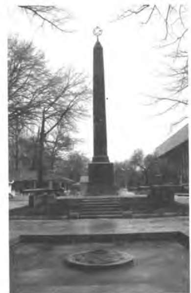
Кызыл гвардияларга коюлган обелиск. Бишкек ш.