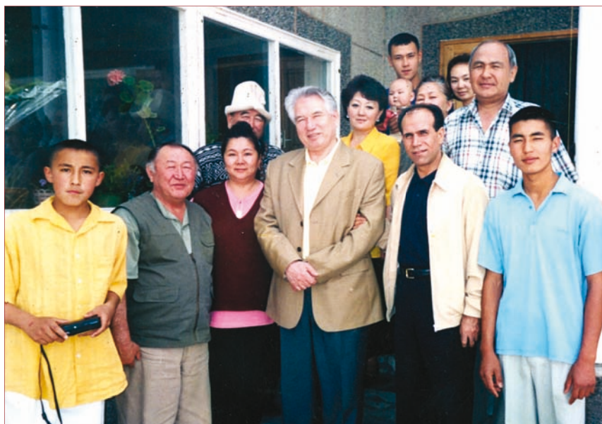
На фото Казат Акматов (второй слева) и Чингиз Айтматов