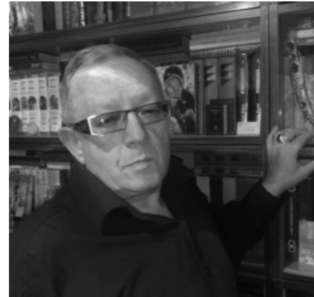
Вячеслав ШАПОВАЛОВ, народный поэт КР

На той земле, что снится каждый раз Когда душа томима ожиданием, На той земле закат уже угас, И месяц вышел к туче на свиданье, И тёплая озёрная вода К песку, шепча, ласкается игриво, И в ней полынь расчёсывает гриву, И на осколки множится звезда... И я бреду по мокрому песку – Увы! – следов уже не оставляя, И как звезда разбиться вдрызг могу И раствориться в нежности без края, Плеснуться рыбой, вскрикнуть чайкой вдруг, Взлететь жучком светящимся из чащи И устремиться в синий купол чаши, Что выронил Творец из сонных рук... На той земле остались навсегда Любви и счастья детские одежды И вечно-путеводная звезда, Венчающая дерзкие надежды.