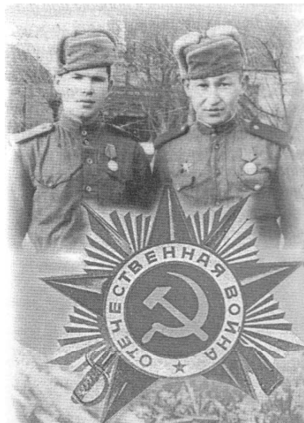
В перерыве между боями. 1944 г.

На привалах, в перерывах между боями мы, однополчане, рассказывали друг другу о жизни в мирное время, о традициях, обычаях людей того края, где родились, выросли, откуда были призваны на фронт. А парни у нас подобрались чуть ли не со всего Союза. Интересно, как выглядел бы дом, если бы нам пришлось сообща его строить с учетом, так сказать, национальной специфики каждого? И представляли мы наш общий