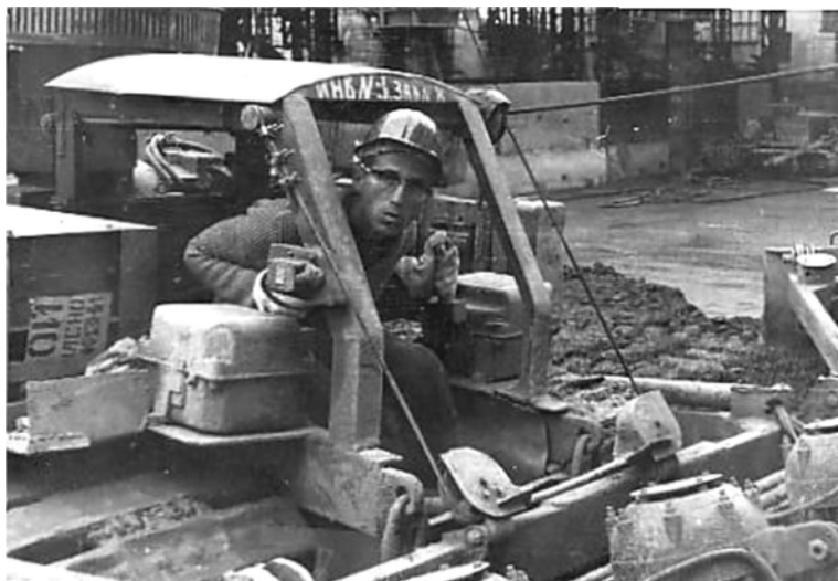
Заставь Сандлера бетон уплотнять...